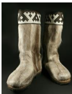
Фото 16. Пимы

Традиционная женская обувь у коми почти не различалась по покрою. В зимнее время носили валяную обувь («тюни», «катанки») – валяные головки с пришитыми суконными или холщовыми голенищами. В северных районах зимой носили «тцбцки»- сапоги высотой 40 см из оленьего меха ворсом наружу; «пимы» - сапоги с голенищем выше колен, также сшитые из оленьего меха ворсом наружу (фото 16). Летом и осенью коми носили: поршни, сшитые из сыромятной кожи и стягиваемые у щиколотки ремешком; коты - кожаную обувь с невысоким суконным голенищем (фото 17-18). Такую обувь носили поверх холщовых портянок или шерстяных узорчатых чулок. На Лузе и Вычегде носили лапти, плетеные из бересты и липового лыка (фото 19).