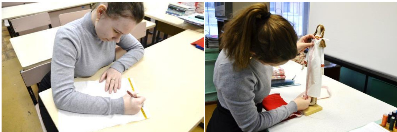
Фото 26-27. Пошив длинной рубахи

Из белой ткани раскроила и сшила длинную рубаху, которую украсила коми орнаментом и яркой тесьмой по низу рукавов и по горловине (фото 26-27).