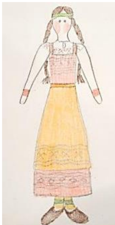
Рис. 2. Эскиз традиционного женского костюма коми

Изучив особенности коми национального женского костюма, был разработан эскиз наряда для куклы Тильды (рис. 2). За основу был взят сысольский женский костюм.