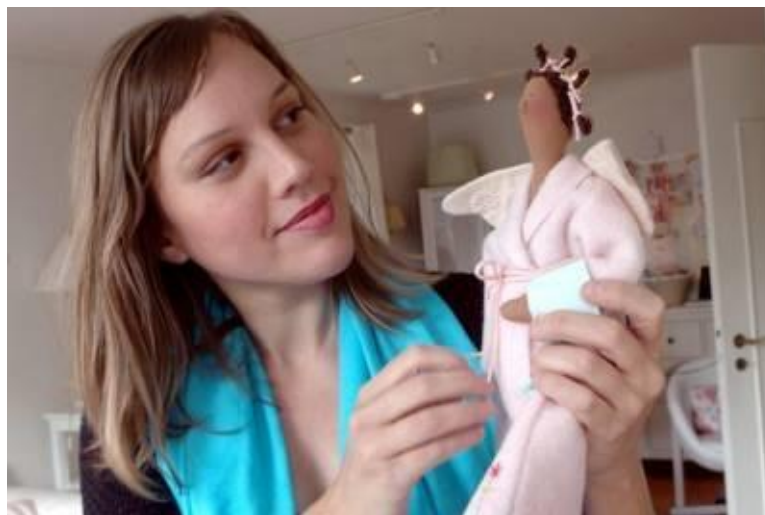
Фото 1. Норвежка Тонни Финнангер – создательница куклы Тильда

Тильды очень популярны сегодня по всему миру. Тильда – это не просто название игрушки, имя куклы, это настоящий бренд. А придумала этих созданий дизайнер из Норвегии Тони Финнангер девятнадцать лет назад, в 1999 году (фото 1).