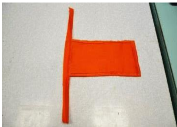
Фото 31-34. Пошив передника

Волосы заплела в косы, а голову украсила атласной лентой. На лице нарисовала глазки – бусинки и навела традиционный для куклы Тильды розовый румянец (фото 35). На ногах нарисовала чулки и обула куклу в поршни, сшитые из искусственной кожи.