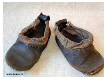
Фото 18. Коты