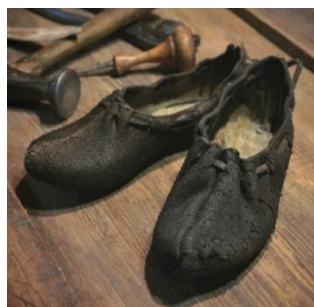
Фото 17. Поршни