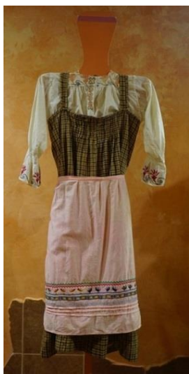
Фото 7. Костюм женский. Сысольские коми