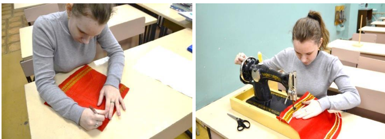
Фото 28-30. Пошив сарафана

Сарафан прямого силуэта сшила из красной ткани, предварительно украсив заготовку орнаментом и контрастной тесьмой (фото 28-30).