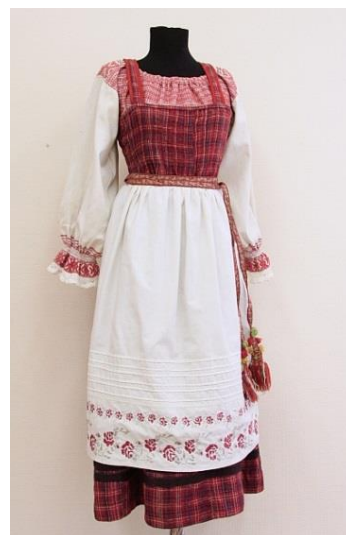
Фото 8. Костюм женский. Прилузские коми

Традиционную женскую одежду коми изготавливали из холста («дöра»), сукна («ной»), шерсти («вурун»), меха («ку») и кожи («кучик»). Праздничная одежда шилась из тонкого полотна, сукна самого лучшего качества, а в более поздние времена из фабричных тканей. Самые зажиточные люди могли носить даже шелка, парчу, атлас и кашемир.