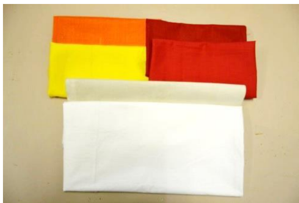
Фото 25. Материалы для создания костюма

Из белой ткани раскроила и сшила длинную рубаху, которую украсила коми орнаментом и яркой тесьмой по низу рукавов и по горловине (фото 26-27).