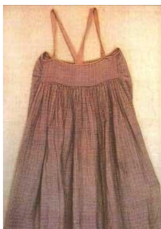
Фото 10. Сарафан