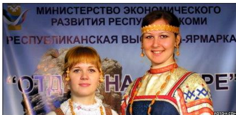
Фото 12-13. Головные уборы коми девушек

На свадьбе девушка надевала баба-юр, похожий на русский кокошник, и до самой старости не имела права его снять (фото 14). Показать волосы, лишившись баба-юра, считалось огромным позором.