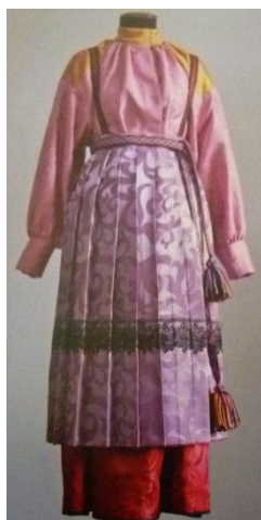
Фото 3. Костюм женский. Ижемские коми

Традиционная одежда коми народа в основном сходна с одеждой северо-русского населения. Народная одежда коми достаточно разнообразна и воплощает в себе самобытность и национальную культуру народа. При этом, традиционный мужской костюм единообразен на всей территории, за исключением зимней одежды коми-ижемцев. Женская одежда отличалась значительным разнообразием, которые касаются техники кроя, использованных тканей, орнаментации. По костюму можно было определить район проживания и социальный статус владелицы. Исходя из этих различий, выделяют несколько разновидностей традиционного женского костюма в зависимости от территории поселения: ижемский, печорский, удорский, вычегодский, сысольский и прилузский (фото 3-8).