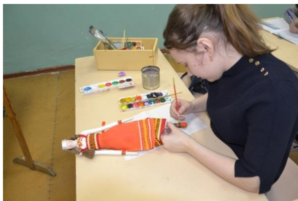
Фото 36. Создание обуви для куклы Тильды