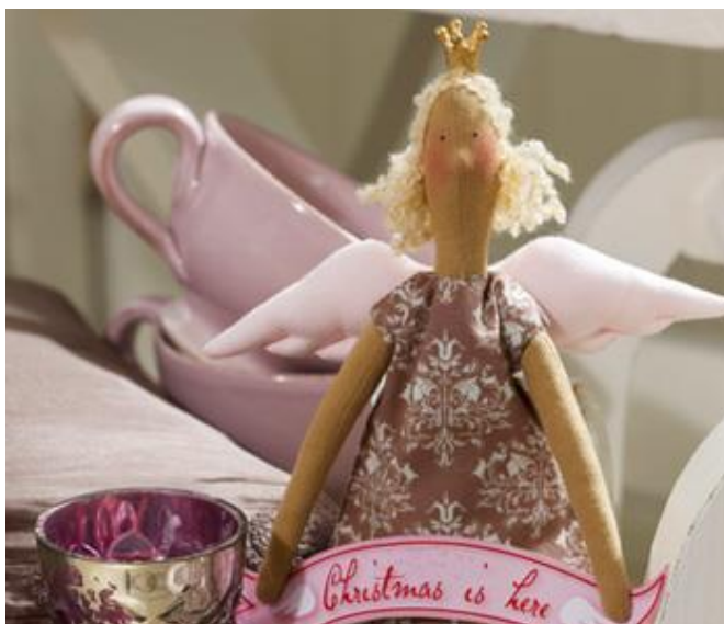
Фото 2. Кукла Тильда

Обычно кукла Тильда шьется из тканей пастельных тонов, но некоторые авторы пытаются применять и яркие акценты. Для создания одежды применяются и легкие ситцевые ткани с мелким набивным рисунком, и плотный войлок.