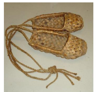
Фото 19. Лапти