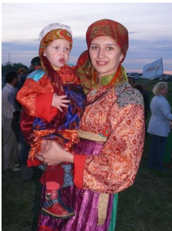
Фото 14. Баб-юр – головной убор замужней женщины

К числу головных уборов на твердой основе относится сборник, который невеста надевала на свадьбу, а после женщина носила его по праздничным дням. Сборник шили из парчи или шелка на подкладке. Он состоял из чепца и твердого околышка, высота которого достигала спереди 10 см. На стыке чепца и околышка ткань стягивалась в сборки, поэтому головной убор называли «сборник». На чепец повязывали шелковый платок (фото 15).