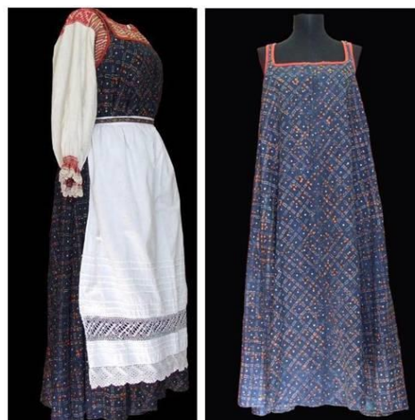
Фото 6. Костюм женский. Вычегодские коми