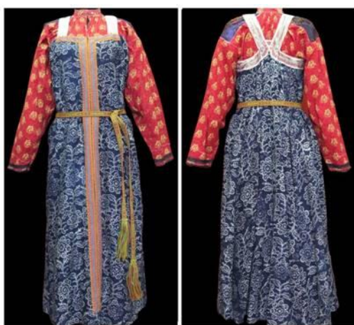
Фото 5. Костюм женский. Удорские коми