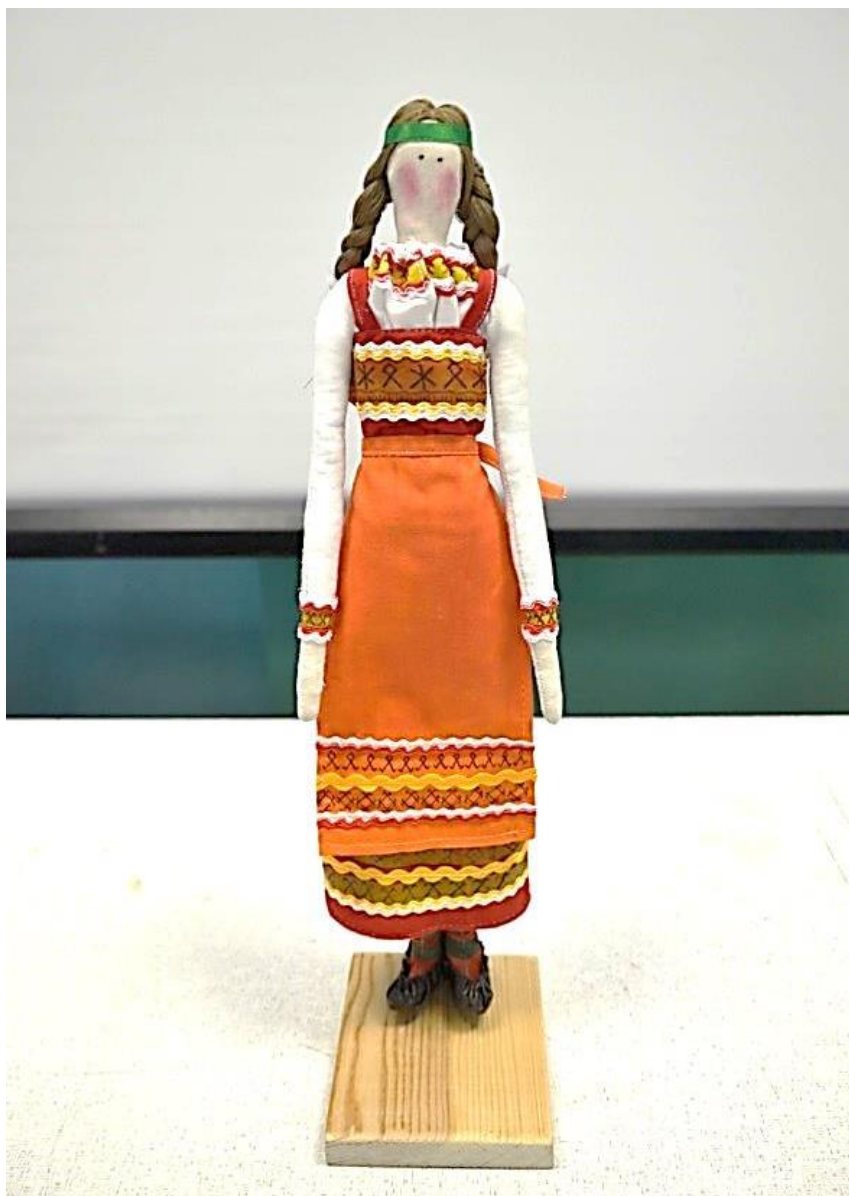
Фото 37. Кукла Тильда в коми национальном женском костюме

Получилась вот такая кукла Тильда в традиционном женском наряде коми (фото 37).