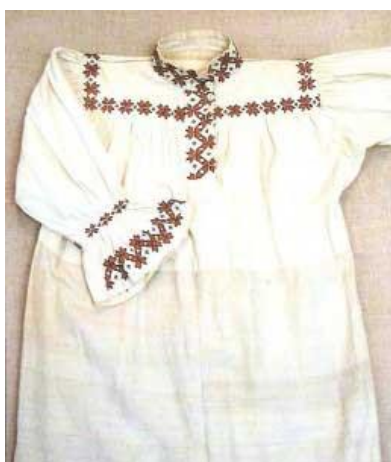
Фото 9. Женская рубаха

с тем, что к основному материалу пришивались вставки, вырезанные по косой линии, что придавало сарафану объем. Круглые сарафаны шились из нескольких полос ткани, образуя подобие «трубы». Сарафаны украшались тесьмой, пришитой спереди и по подолу. В противовес белой и серой ткани рубах, этот предмет гардероба старались шить из яркой ткани. Даже повседневный наряд женщины коми должен был подчеркивать её красоту и умения хозяйки. Поверх сарафана коми женщины носили передник без нагрудника («запон») (фото 11).