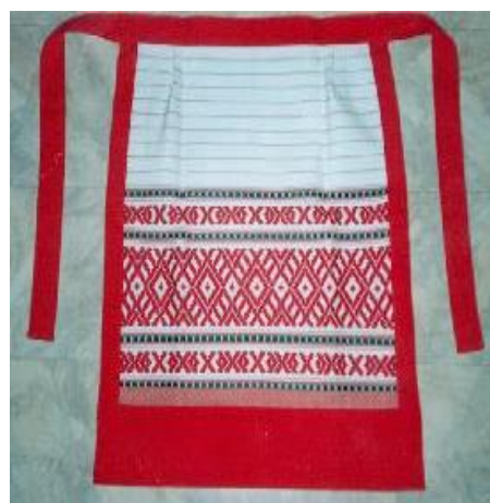
Фото 11. Передник

Праздничная одежда по крою совпадала с повседневной, но была гораздо богаче украшена вышивкой и шилась из более качественных и дорогих тканей. Богатые коми надевали поверх сарафана парчовые безрукавки. Юбки, платья и рубашки появились в гардеробе коми только к середине 20 века. Но и в них женщины придерживались привычных цветов и фасонов.