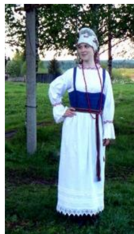
Фото 4. Костюм женский. Печорские коми