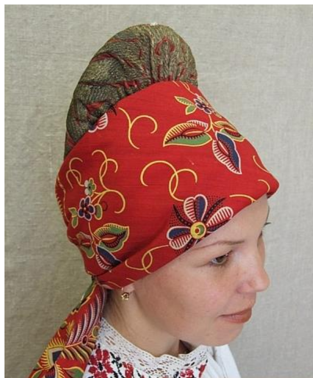
Фото 15. Сборник – праздничный головной убор замужней женщины