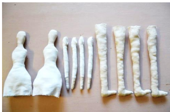
Фото 20-24. Процесс пошива куклы Тильды