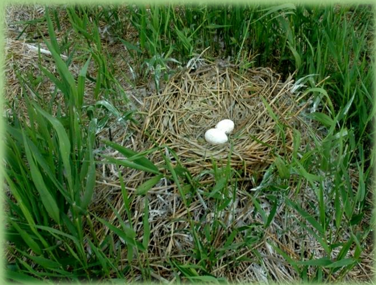
Гнезда кудрявого пеликана на острове Ейская коса