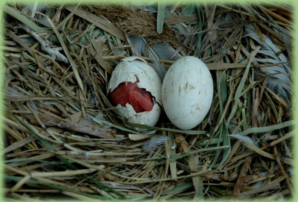
Птенцы кудрявого пеликана на острове Ейская коса