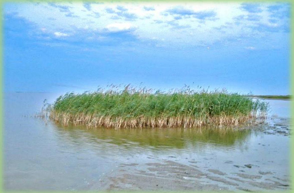
Ханское озеро до 2007 года