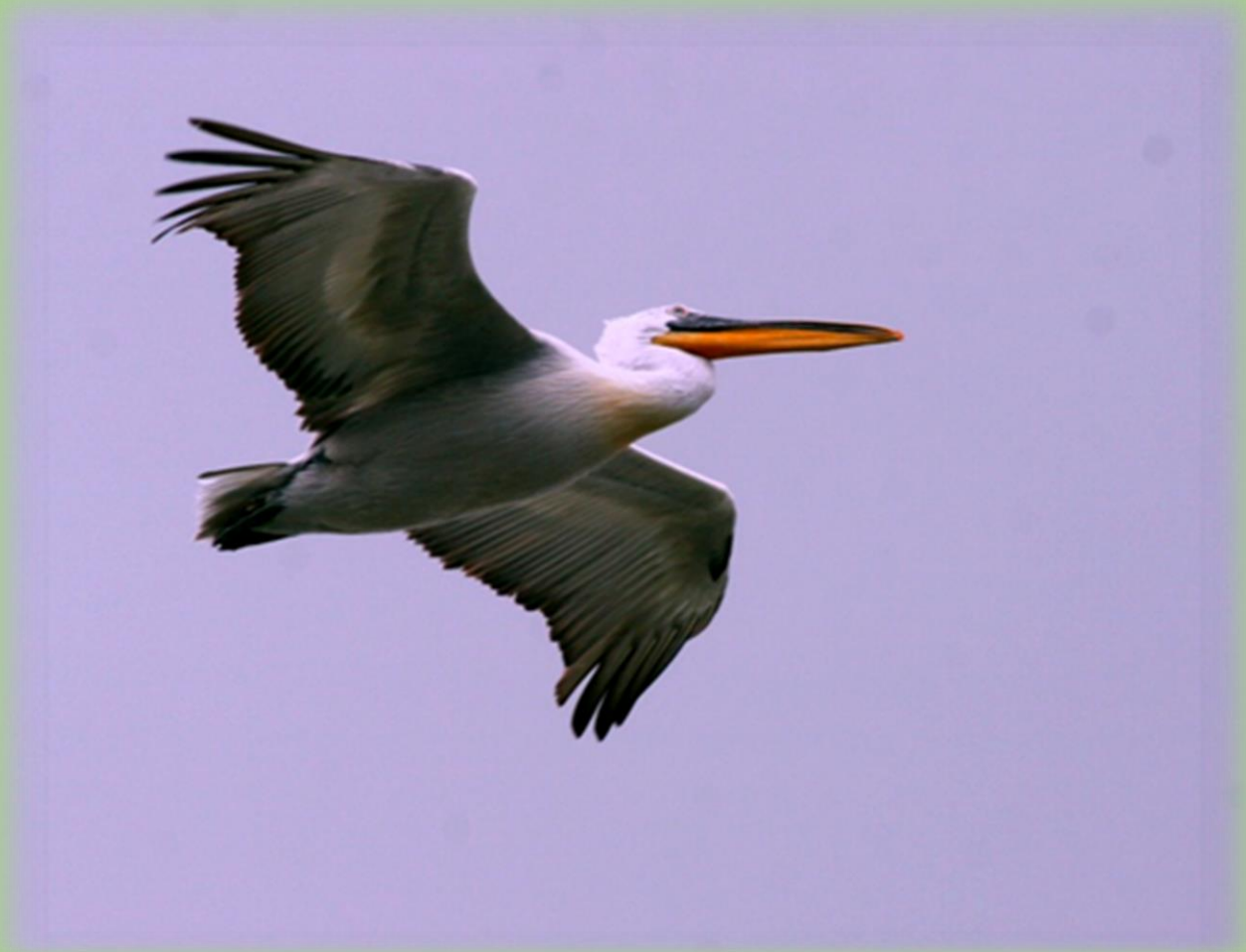
Кудрявый пеликан ( Pelecanus crispus )