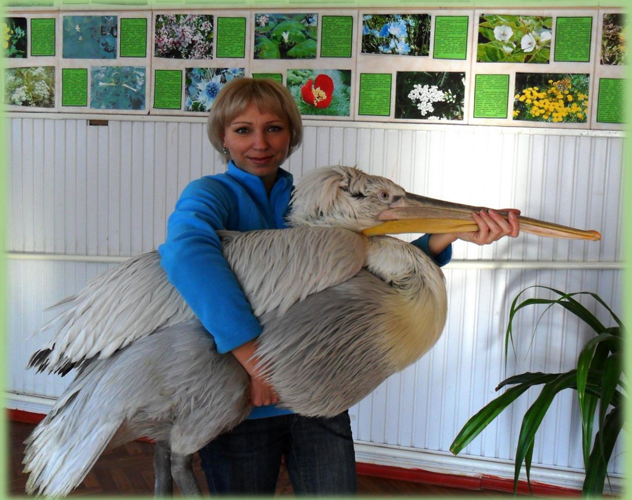
Кудрявый пеликан в ЭБЦ г.Ейска