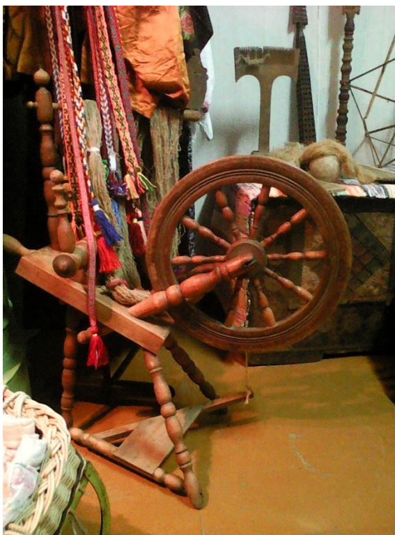
Самопрялка, Диево-Городище, 26.10.2010