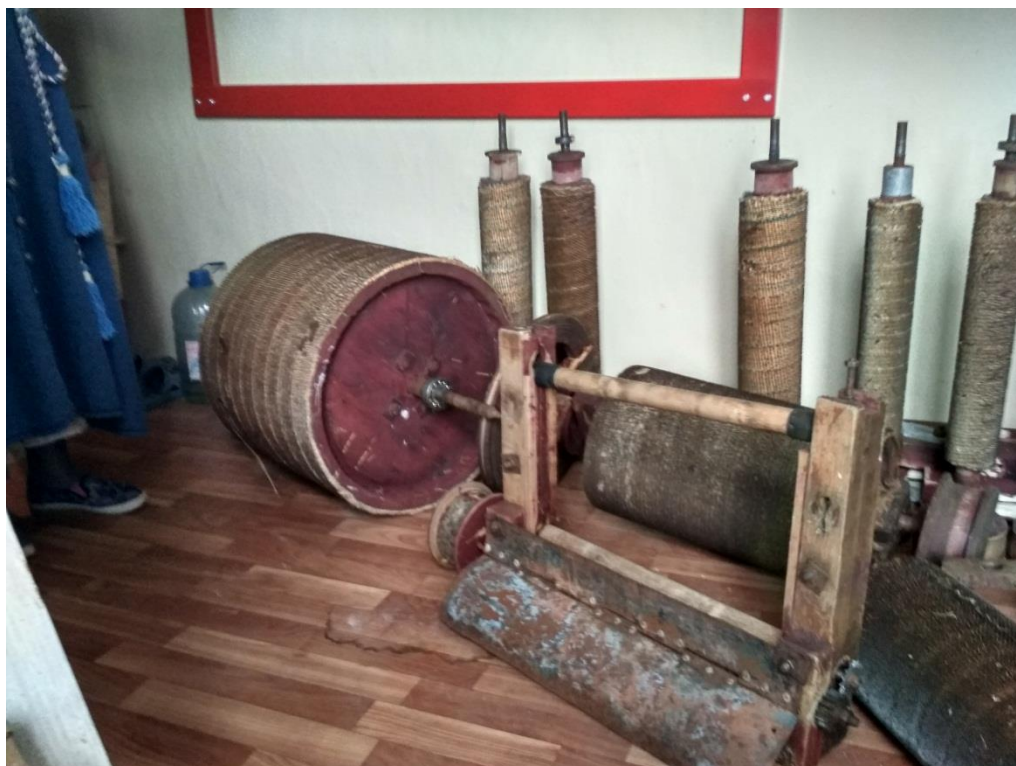
Элементы шерстобитного станка, Диево-Городище, 26.10.2018