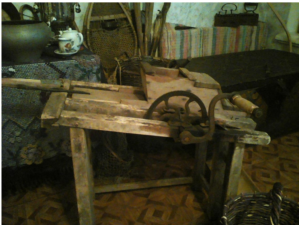
Картофельно-тёрочный станок, Диево-Городище, 26.10.2018