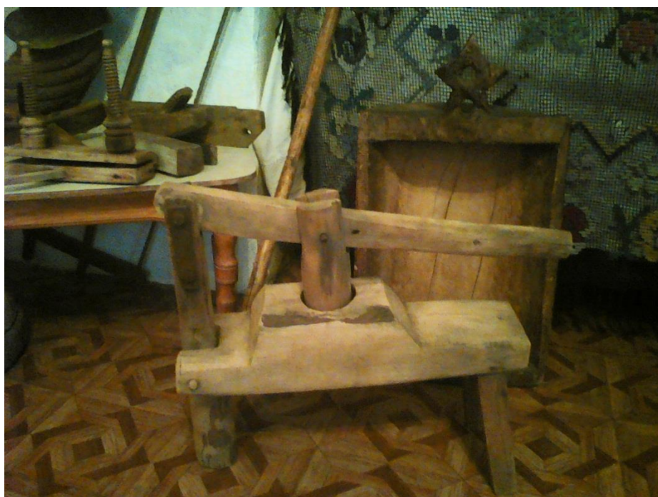
Картофелемялка, Диево-Городище, 26.10.2018