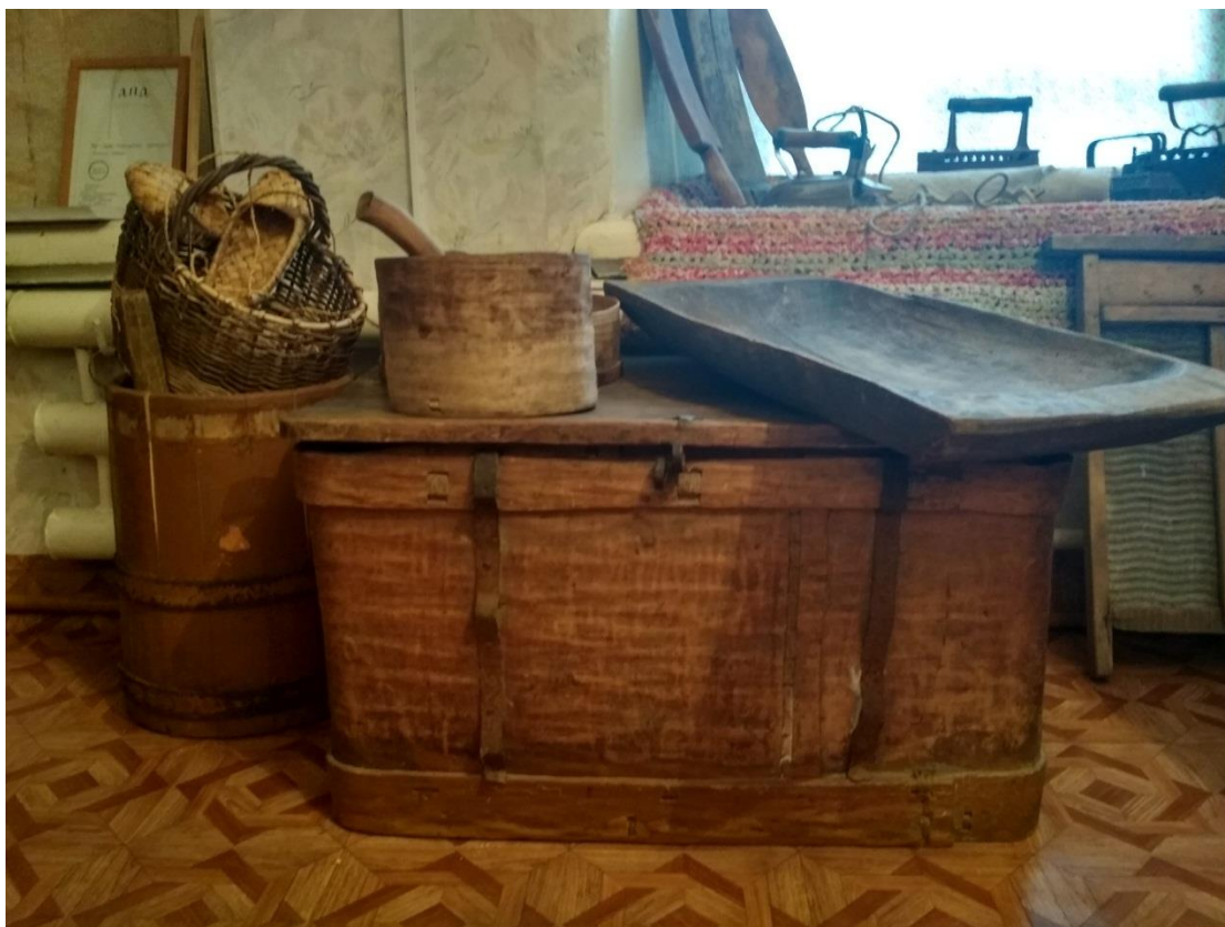
Предметы быта для хранения муки, Диево-Городище, 26.10.2018