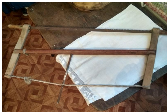
Лучковая пила, Диево-Городище, 21.09.2018