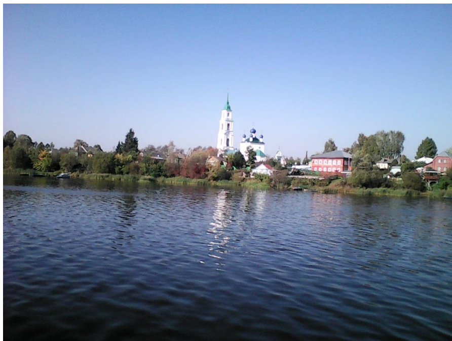
Вид на Диево –городище со стороны Волги с теплохода, 21.09.2018