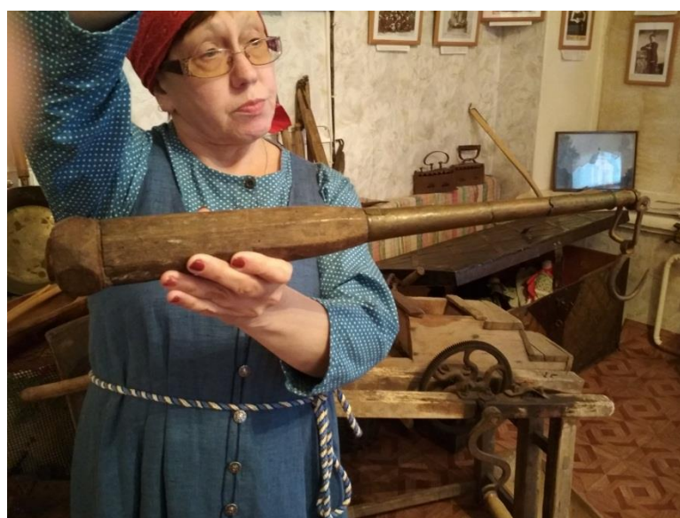
Применение весов-безмена, Диево-Городище, 26.10.2018