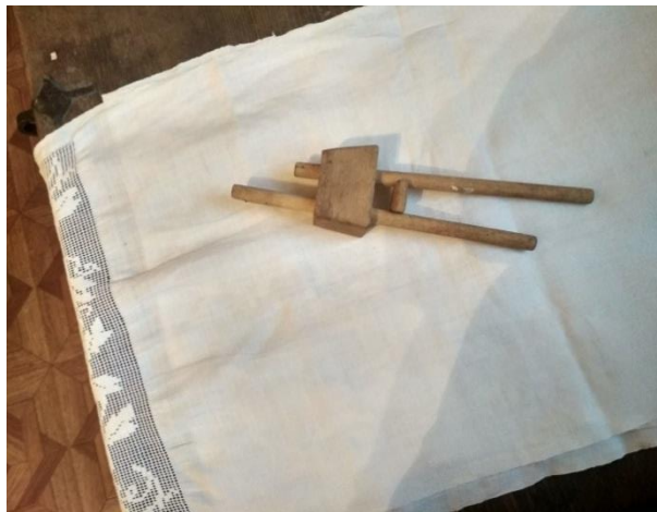
Деревянный циркуль, Диево-Городище 21.09.201