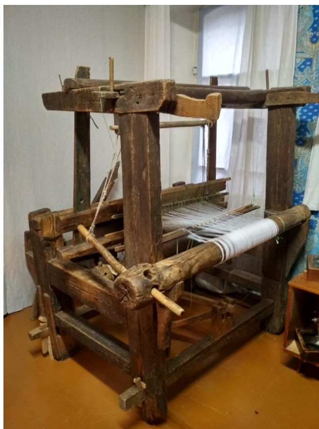
Ткацкий станок, Диево-Городище, 26.10.2018