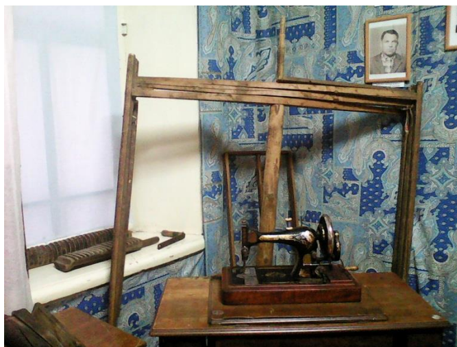
Вороб, Диево-Городище, 26.10.2018