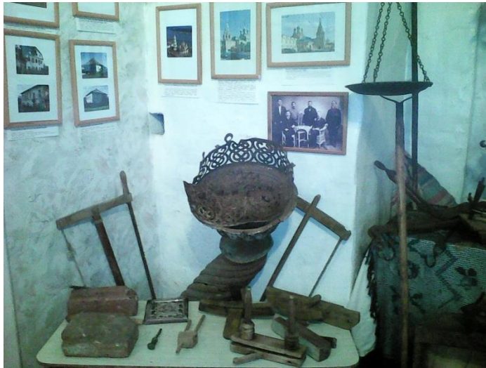
Экспозиция, посвящённая отходничеству крестьян, где размещены плотнические орудия труда, Диево-Городище, 27.10.2018