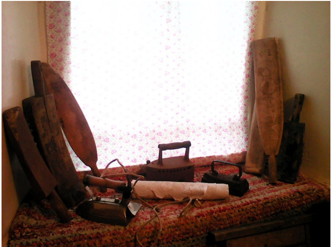
Предметы для стирки, сушки белья, Диево-Городище, 26.10.2018