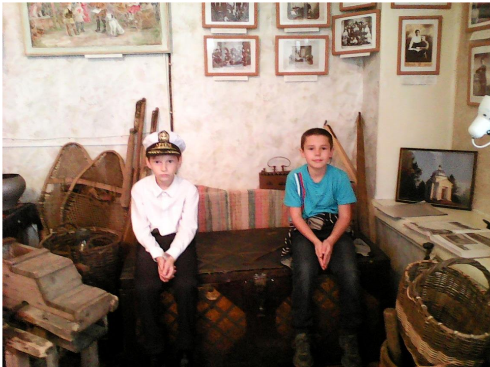
Экскурсия по Волге в село Диево-Городище, 21.09.2018