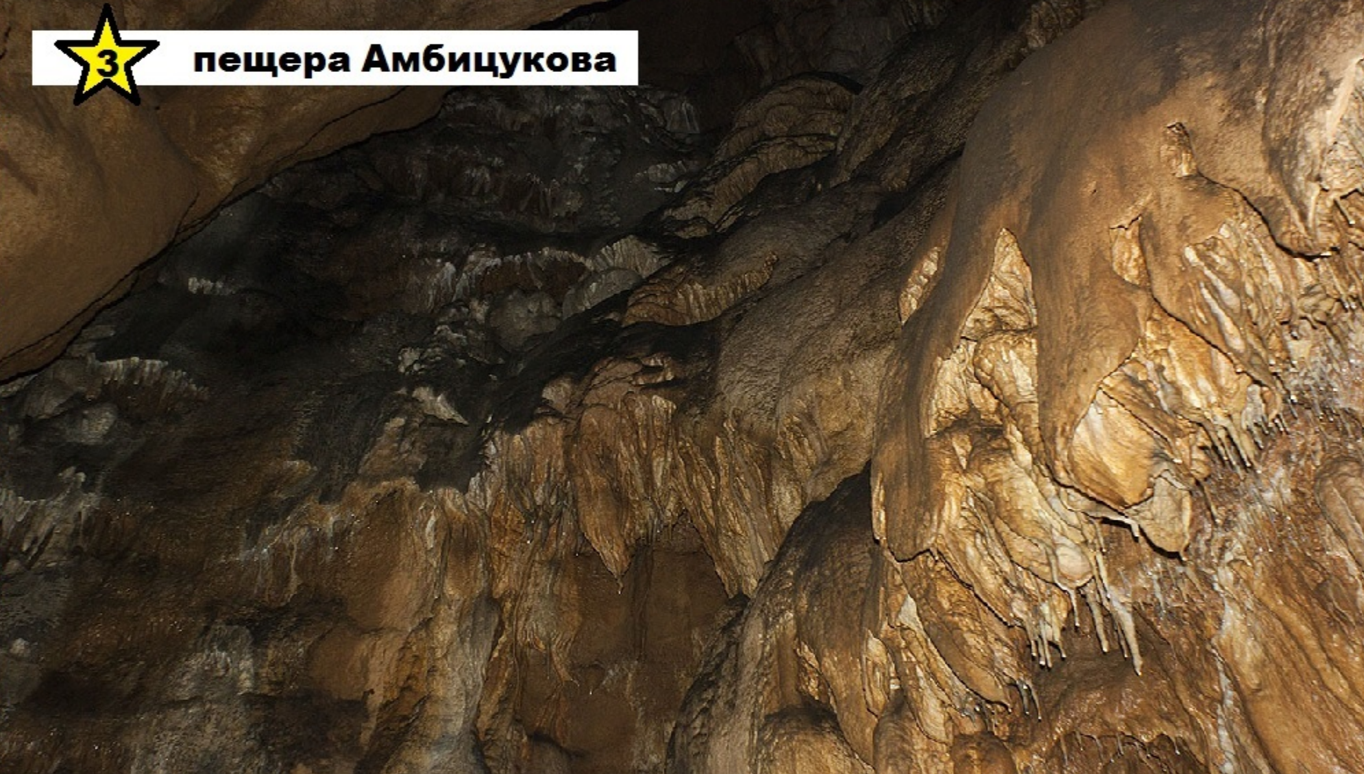
★ пещера Амбицукова