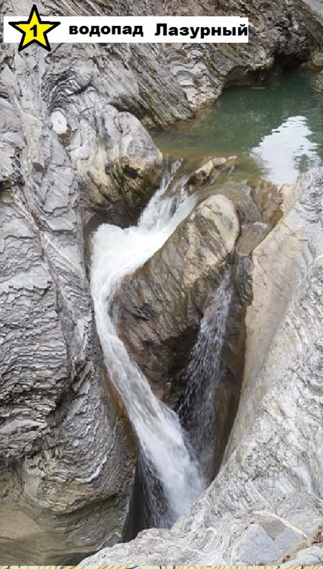
★ водопад Лазурный