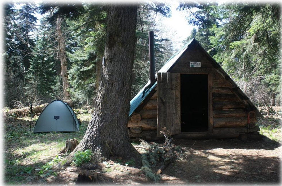
Приют (балаган) «Юбилейный»

Балаган Юбилейный, представляет собой основательный бревенчатый сруб, с просторной комнатой, в которой есть стол и нары, устланные хвойными лапами. В балагане с комфортом разместятся четверо путников, а если хорошо потесниться, то думаю и ввосьмером можно поместиться. Родник вблизи балагана является нестабильным и летом его может не быть вообще. Если родника нет, то необходимо не задерживаться и отправляться до следующего балагана Шестакова, т.к. все разведки показали, что воды больше поблизости нет. [12]