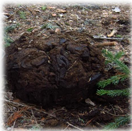
Экскременты зубра кавказского

Балаган почти полностью сожжен и поэтому возможности остановиться в нем нет. Мы посетили его и вдруг внизу, на поляне увидели стадо зубров. Как мы выясняли потом, это их естественное место обитания. Наш маршрут пролегает по границам заповедника, который очень успешно занимается разведением кавказского зубра, и на сегодняшний момент поголовье зубра составляет более 1000 голов. Следы их жизнедеятельности в часто встречаются на маршруте.