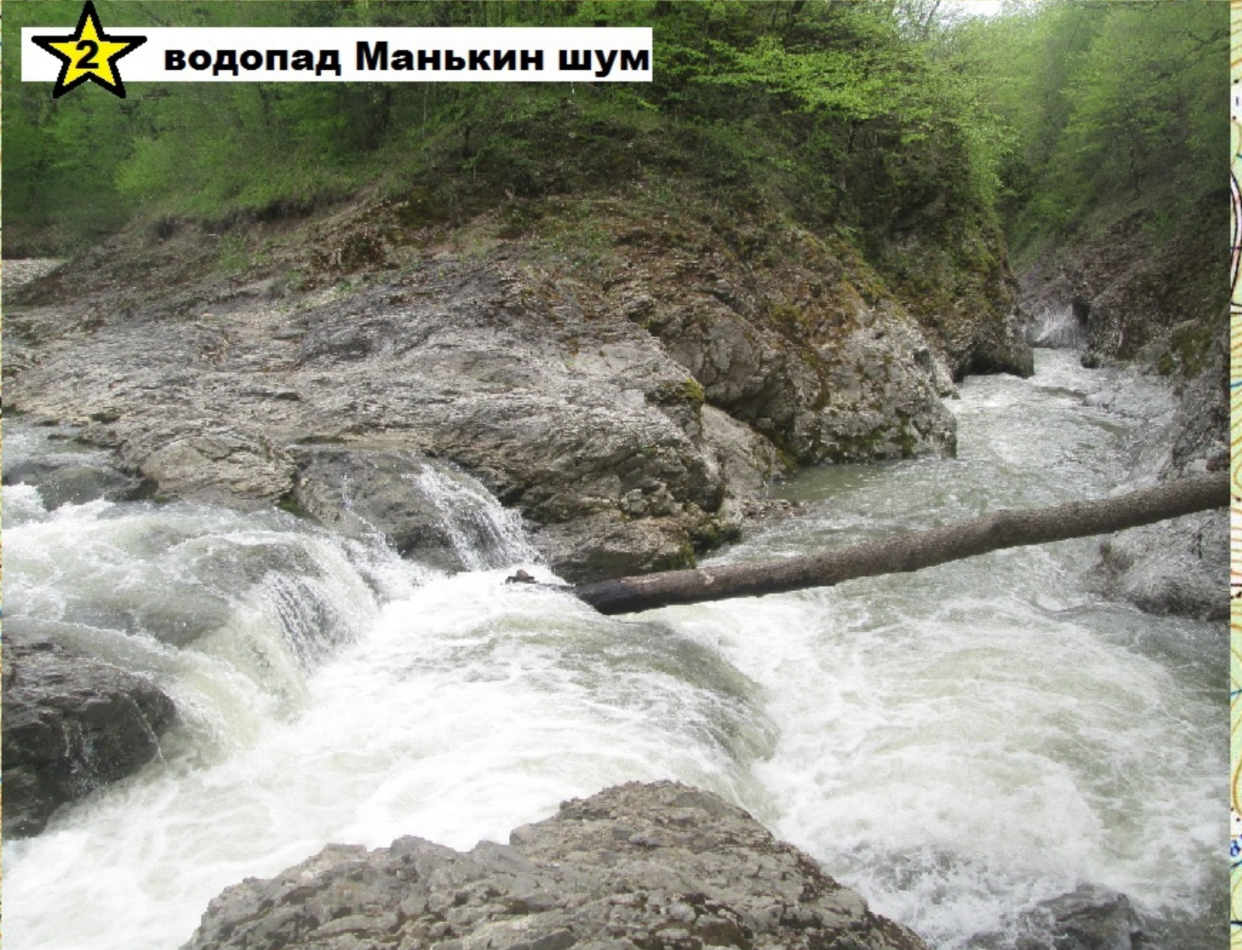
★ водопад Манькин шум