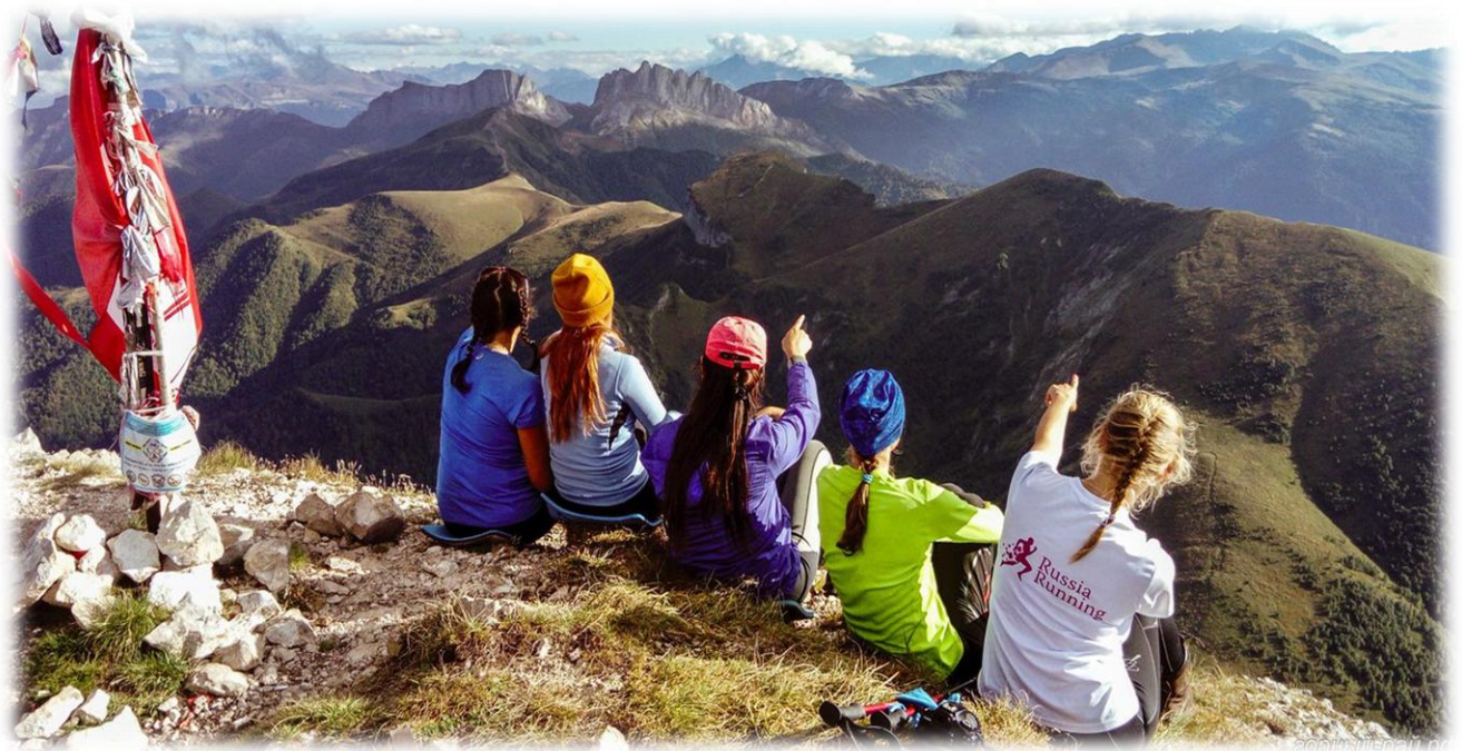
Вершина Большого Тхача (2368 м.н.у.м.)

Сфотографировавшись на вершине, нашли на триангуляционном знаке в целости и сохранности баннер нашего клуба «Азбука туризма», размещенный здесь в прошлом походе.