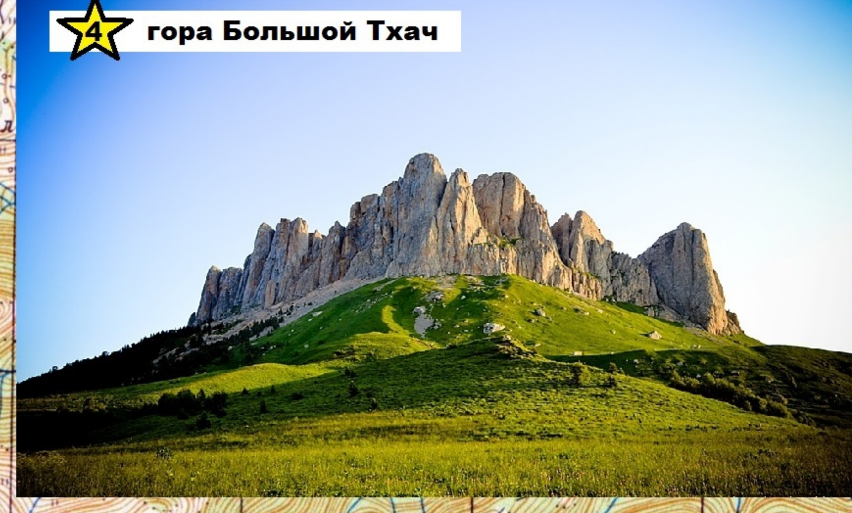
★ гора Большой Тхач