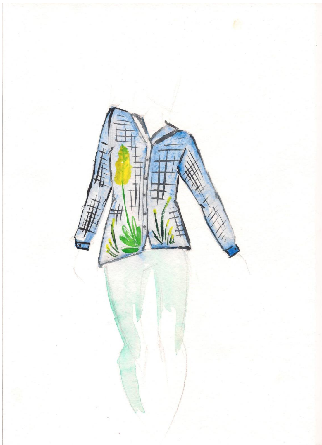
Модель 3 (Вторичное использование рубашки)