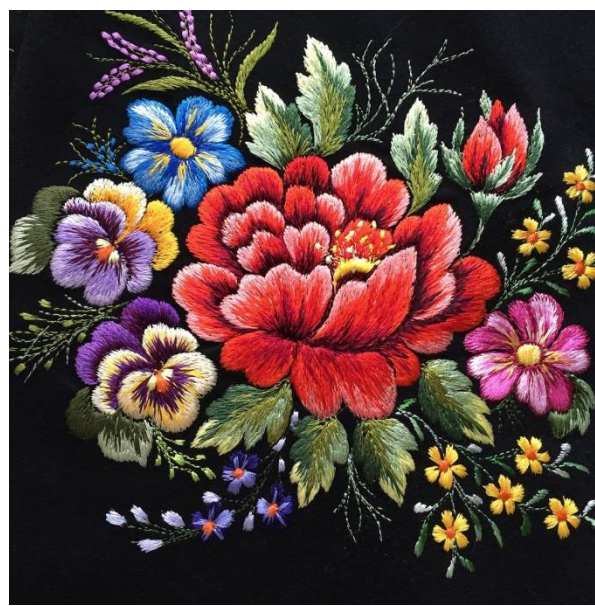
Примеры работ донской мастерицы