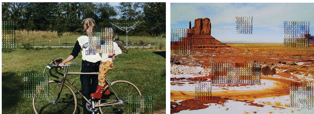
Работы американской художницы Диана Мейер