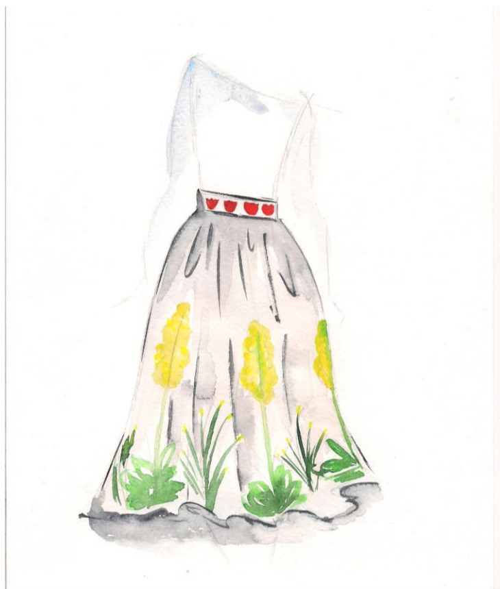
Модель 2 (Юбка)