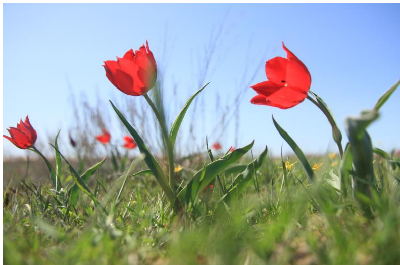
Тюльпан Шренка (лазорик)