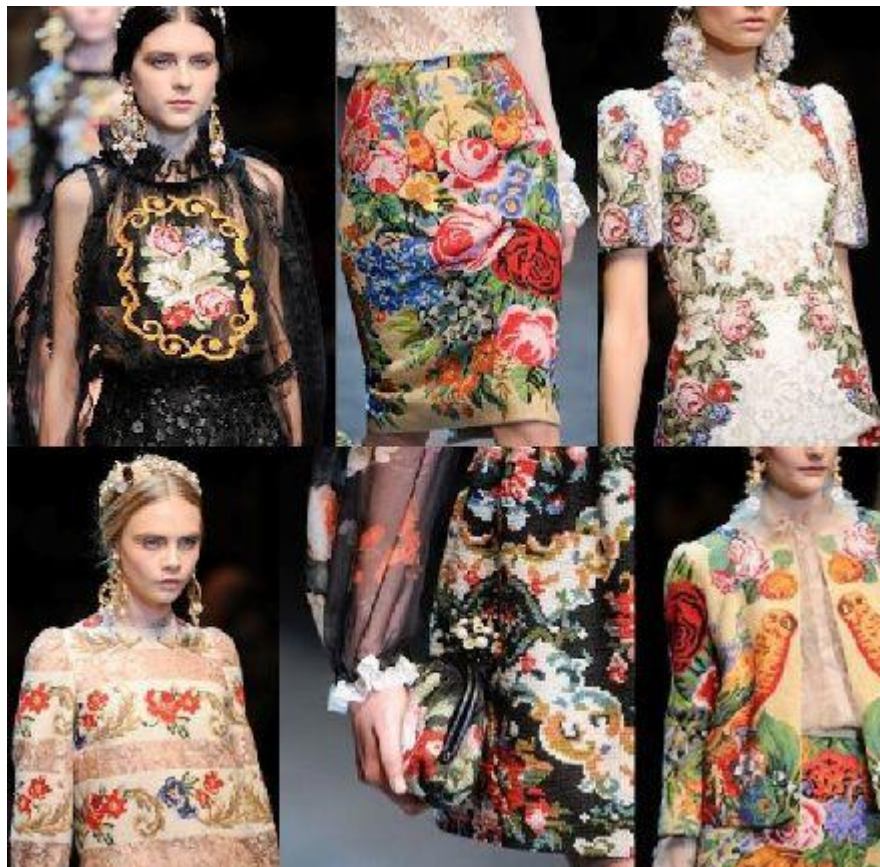
Фото с недели моды