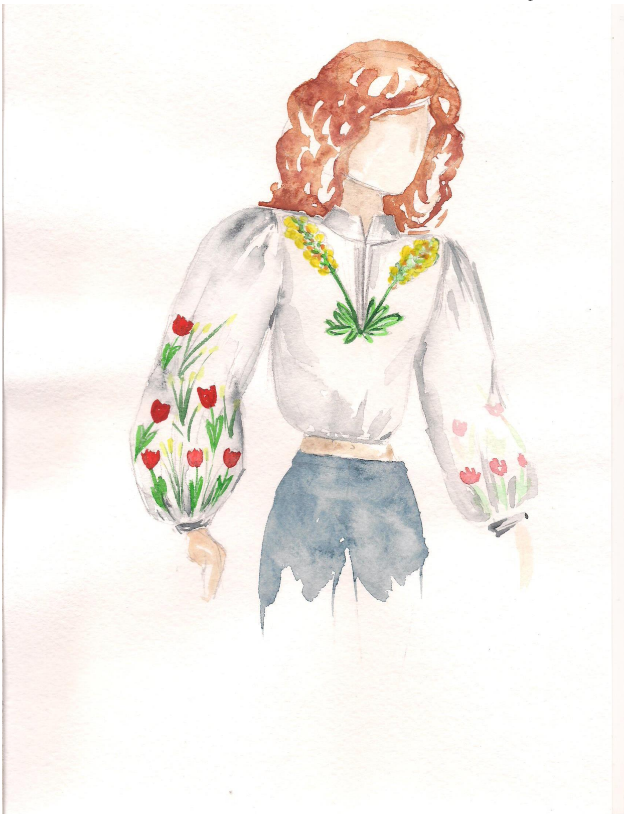
Модель 1 (Блуза)