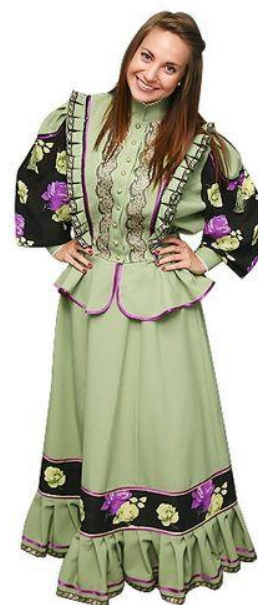
Традиционный костюм донской казачки