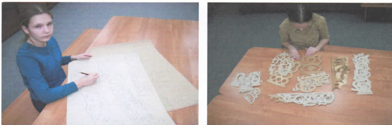
Рис.38-39. Процесс изготовления и сортировки собранных орнаментов.

3. В ходе выполнения работы были определены этапы изготовления сквозной резьбы. Освоить процесс и научиться работать с деревом мне помог мой папа, которому свой опыт передал мой прадед Чухлов В.Б.. Мною были изготовлены основные элементы, украшающие столбы наличника, а также часть соляных знаков, характерных для Мытского наличника (рис.40-43.).