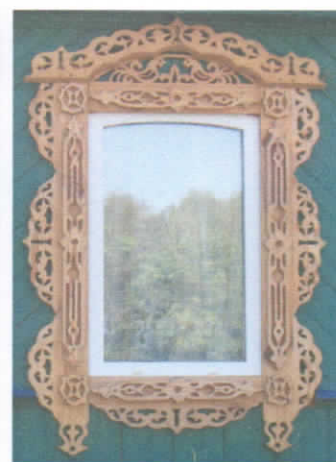
Рис.15. Наличник седьмой группы