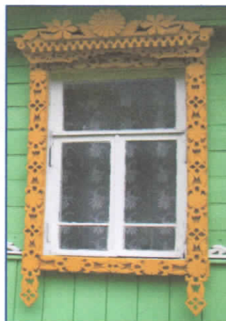
Рис.14. Наличник шестой группы

Приведенная нами классификация отличается от известной классификации наличников, представленной Рыбаковым Б.А. в книге «Язычество Древней Руси» [11], основанной на символике наличников и соляных знаков, а также классификации, приведенной Журавлевым В.П. в книге «Земля умельцев. Прошлое и настоящее Пестяковского района» [5].