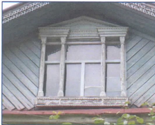
Рис.3. Светелочный наличник из д. Соловьево

Из книги «Мир жилища» Ивянской И.С [8], мы выяснили, что в середине 19 века появилась мода украшать наличниками не только красные окна, но и чердачные оконца или светелочные. Наличники, украшавшие данные окна, отличались широкой лобовой доской с полукруглым вырезом, напоминающим арку. Сама лобовая доска украшалась широкими, раскидистыми листьями и стеблем, по середине которых располагалась дата строительства дома. Колонны зачастую точеные, полотенце неширокое также украшалось глухой