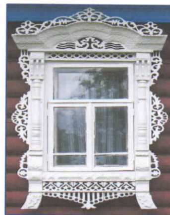
Рис.9. Наличник первой группы

Полукруглая арка украшается геометрической резьбой, полукругами, скобчатыми порезками, верхняя часть очелья и колонки украшаются разнообразным сквозным рисунком. Реже верхняя планка в виде треугольника заменяется прорезной резьбой, что подчеркивает и выделяет очелье. В верхних углах обеих колонн располагаются кронштейны. Поверхность колонн украшена точеными деталями. Зрительный ряд наличника заканчивается широким полотенцем. Дату распространения удалось выяснить точно (1950-2000 гг), так как методику их изготовления разработали мастера: Муратов К.К. и Чухлов В.Б..