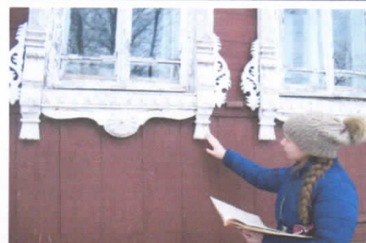
Рис.17. Изучение наличников