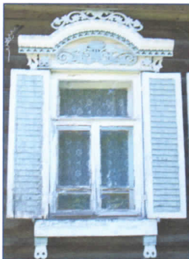
Рис.12. Наличник четвертой группы

встречается на территории Симаковского поселения. Ставни встречаются и используются на 2, 5 и 6 группах наличников, выделенных нами.