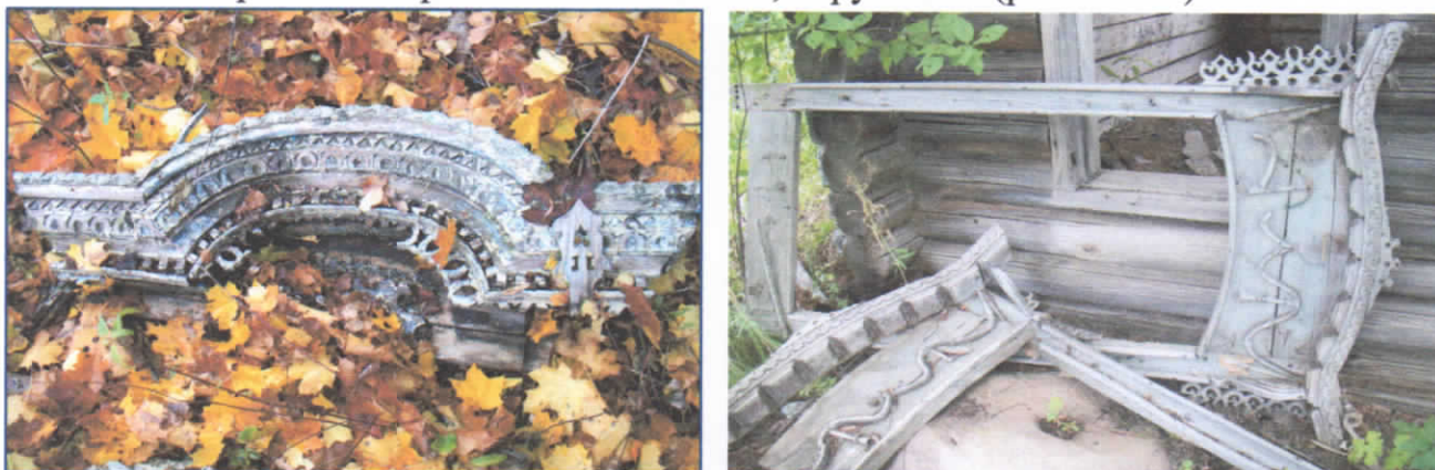
Рис.35-36. Наличники, гниющие на земле.

Печально видеть и осознавать тот факт, что многие деревни, где зарождалось ремесло, исчезают одна за другой. Наряду с ними пропадают традиции украшать дома наличниками, особенности резьбы в каждой местности. И многолетний, тяжелый труд современным поколением воспринимается как пережиток старого, и зачастую варварски уничтожается. Наш край является не исключением. Это подтвердили экскурсии, проведенные по территории района, где очень часто можно увидеть ужасающую картину: наличники брошены и разломаны на земле, изрублены (рис.35-36.).