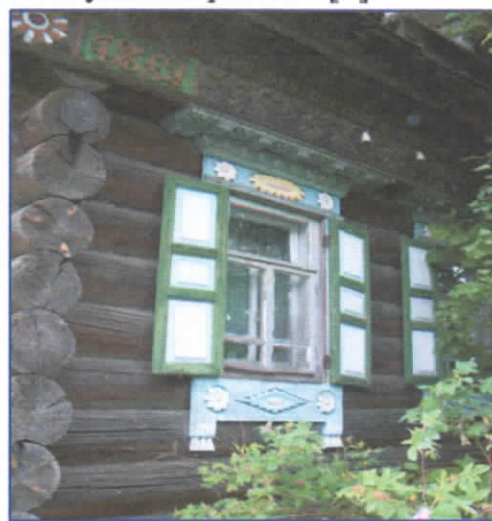
Рис.2. Наличник из деревни Царенково 1812 года