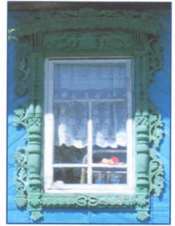
Рис.18. Наличник д. Осинки

дома, украшенные ставнями, но особенно часто встречаются на территории д. Петрово. Для Шатуновских наличников характерна арка, взятая из орнамента глухой резьбы, причем ставни выполнены из параллельно идущих дощечек, через которые может поступать свет. Без внимания не могут остаться наличники в д. Осинки, имеющие изогнутую полочку, украшенную накладной резьбой (рис.18.). Часть орнаментов на территории Кромского поселения на наличниках характерны для села Мыт, например, на наличниках третьей группы такой же S – образный завиток с 5 и 7 листьями. Наличники первой группы на данном участке отсутствуют.