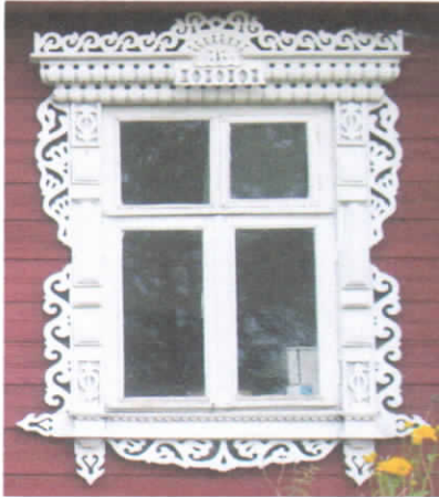
Рис.21. Пестяковский наличник

Наличники со ставнями зачастую украшены накладным растительным орнаментом. Именно эта группа преобладает в Симаковском поселении. Традиционным наличником для Симаковского поселения является наличник с прямой полочкой и ставнями. Наличники первой и второй группы на территории данных поселений не характерны. Наиболее типичный наличник с пышно украшенной многоярусной аркой с «ушками» представлен в деревне Перепелино. Отличительным элементом в орнаментах данных территорий является наличие парных завитков в «ушках» очелья. Особый интерес вызвала арка наличника из деревни Крутовская, изготовленная из цельного массива ступенчатым орнаментом, напоминающим накладную резьбу, что свидетельствует о высоком уровне мастера. На территории Симаковского поселения обнаружено три дома, украшенных наличниками с прямой многоярусной полочкой, характерной для территории Пестяковского района. Но «полотенце» и столбы наличника украшены традиционным Мытским орнаментом – кувыркающимся S-образным завитком. В боковых орнаментах распространено изображение стилизованных лошадей и птиц (рис.21.). [5]