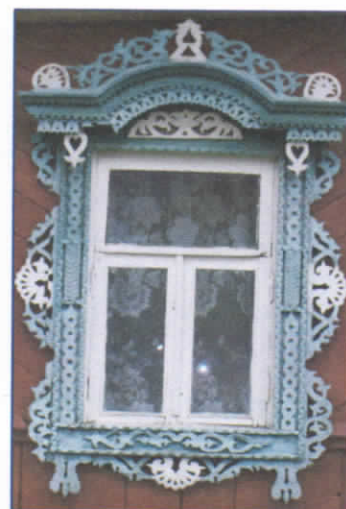
Рис.10. Наличник второй группы

Наличники второй группы - с многоярусной аркой, выполненные преимущественно накладной и ажурной резьбой (рис.10.). Встречаются несколько видов: с узким или широким полотенцем. Многоярусная арка украшена чередованием треугольников и квадратов и свисающими по краям кисточками. Внутренняя часть арки украшается сквозной или накладной резьбой. Основной орнамент, характерный для данной группы наличников, растительный. Столбы украшаются точеными деталями. Время распространения по территории района – начало 20-го века.