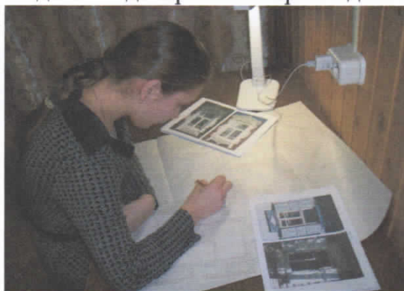
Рис.44. Процесс разработки схем

4. Посещая Мытский дом ремесел, и увлекаясь вязанием, вышивкой, ткачеством мне стало интересно: возможно ли применить собранные орнаменты наличников в украшении изделий декоративно-прикладного искусства и ремесел нашего края, что помогло бы в целях сохранения и популяризации информации о наличниках. За советом я обратилась к мастерам студий дома ремесел, которых заинтересовала моя идея, и мне посоветовали начать выполнение задуманного с разработки схем. Мною были начерчены схемы всех групп наличников. Используя разработанные схемы, я изготовила вязаную прихватку, вышитое крестиком панно и тканый коврик (рис.44.).