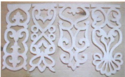
Рис.6. Прорезная резьба