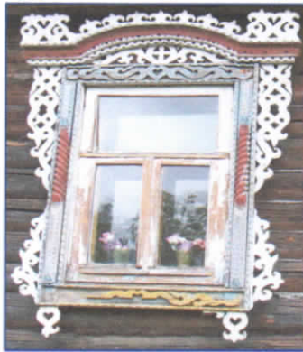
Рис.19. Наличник д. Невра

Особой красотой удивляют наличники деревни Невра и Поневерье, на территории которых проживало не одно поколение опытных резчиков (рис.19.). Наличники отличаются широкими растительными орнаментами по бокам столбов, а также широкими ушками, расположенными по обе стороны арки наличника. Причем арка выполнена из единого бруса длиной от полутора метров, шириной 30см и толщиной 10 см и украшена ступенчато, что придает ей объемность и красочность. Приближаясь к территории Мытского поселения, видишь, что группы наличников меняются.