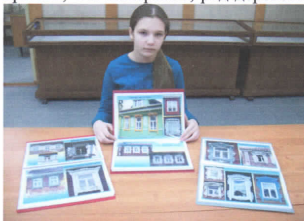
Рис.37. Фотоальбомы наличников.

1. В ходе проведения экскурсий по территории Верхнеландеховского района мною велась фотофиксация домов, украшенных наличниками. Всего было изучено 117 деревень и сел района, причем, что интересно, ряд деревень числится нежилыми, заброшенными н.п. (Верещагино, Заболотье, Кобылино и т.д.) а в них продолжают жить люди. Из результатов исследования следует, что практически каждый второй дом района (рубленный) украшен наличниками. Это поспособствовало сбору уникального фотоматериала по наличникам поселений района, которые были проанализированы. По каждому поселению напечатан фотоальбом с фотографиями наличников (рис.37.).