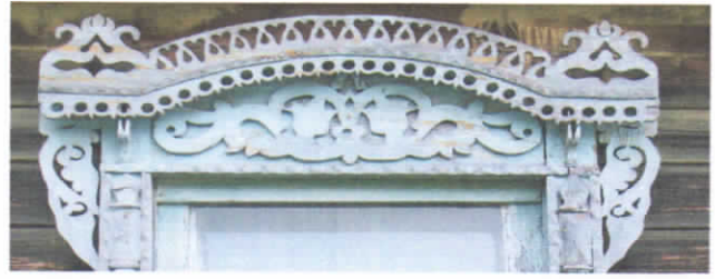
Рис.20. Арка наличника с «ушками»

Кромского резко меняется. Как видно из таблицы, широкое распространение по территории Верхнеландеховского поселения получили наличники пятой группы с широкой «лобовой» доской и изогнутой полочкой, края которой украшаются резными «ушками» (рис.20.).