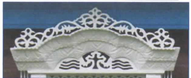
Рис.27. Арка, украшенная фигурой берегини.

4. Фигура женщины берегини – стилизованные женские фигуры, женщины – роженицы (символ материнства, знаний, хранительницы очага) (рис.27.).