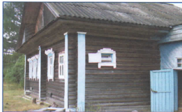
Рис.1. Волоковое оконце. Деревня Поневерье

На ночь оно закрывалось с внутренней стороны деревянной доской, двигавшейся («волочащейся») по специальным вырезанным пазам. Днем в это отверстие вставлялась рама, затянута каким-либо прочным и прозрачным материалом. Пространство между стеной и рамой волокового окна закрывала наружная прямоугольная неширокая рама, защищавшая стыки и мох от намокания. Данную раму со