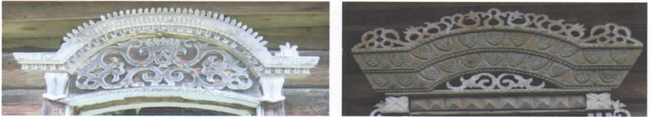
Рис.25-26. Арки, украшенные ромбами, квадратами и полукругами.

2. Знаки воды (земных и хлябей небесных, дождь) – изображались в виде волнообразного узора, символ очищения. Изображение узора в виде капли означает мужское оплодотворяющее начало, символ урожая, плодородия, рубеж между мирами. Данные узоры встречаются в виде украшения разлива наличников на всем изучаемом участке. [9]