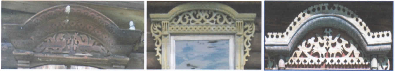
Рис.28-30. Стилизованное изображение животных и птиц.

В резьбе нашего края чаще всего встречаются и прослеживаются солярные знаки различной формы, символы и изображения птиц, животных, растительные сюжеты в виде восходящего ростка и женщины-берегини, а именно: