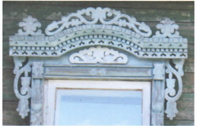
Рис.31. Образец растительного орнамента.

1. Восьми и шести лучевые вертушки наиболее часто украшают столбы наличника. Наиболее традиционны для всех поселений растительные орнаменты, в которых отображается колокольчик, S-образные завитки и стилизованные стебли (рис.31.). Наиболее интересны орнаменты в виде повторяющегося, чередующегося круга, в котором изображен двухлистный росток. Линейный орнамент наиболее часто украшается листом березы с сережками (наиболее широко распространен в нашем крае) листьями дуба, клена, рябины, липы, осины, а также листья земляники. Изображение листьев этих деревьев не случайно, так как эти породы древесины использовались для изготовления домашней утвари и использовались в повседневной жизни (кора липы в лаптеплетении, березовые ветки в бане, рябина в лечебных целях и т.д.). На нескольких арках обнаружены орнаменты, где симметрично вплетена елочка с раскидистыми ветвями, символизирующая мировое дерево.