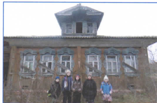
Рис.16. Дом д. Исаково

Из таблицы 1 видно, что на территории Мытского и Кромского поселений встречаются практически все группы наличников, но в каждом селе и деревне сформировался свой удивительный способ украшения наличников, и наличники одной деревни не похожи на другую. На участке от д. Детково до д. Большое Брусово наиболее распространены наличники пятой группы, с широкой лобовой доской, являющиеся продолжением традиций якушевского ремесла. Часто встречаются простые наличники третьей группы с большим количеством растительного орнамента. На территории района сохранились