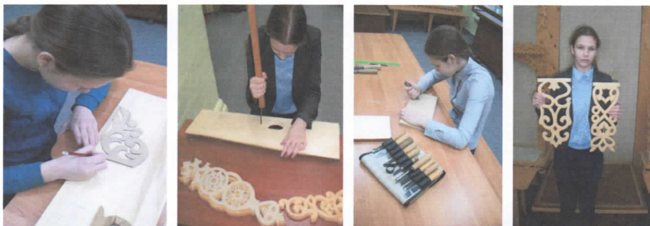
Рис.40-43. Процесс изготовления и сортировки собранных орнаментов.

3. В ходе выполнения работы были определены этапы изготовления сквозной резьбы. Освоить процесс и научиться работать с деревом мне помог мой папа, которому свой опыт передал мой прадед Чухлов В.Б.. Мною были изготовлены основные элементы, украшающие столбы наличника, а также часть соляных знаков, характерных для Мытского наличника (рис.40-43.).