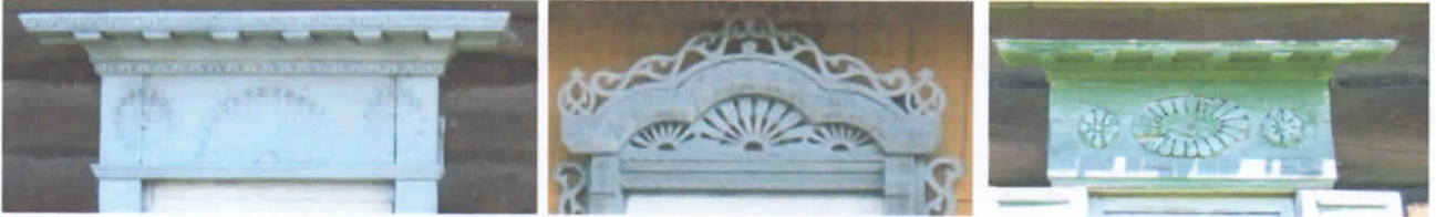
Рис.23-24. Арки, украшенные розетками и лучами

1. Солярные знаки – стилизованное изображение божеств - солнца в виде розетки, полукруга, ромба. Может изображаться в виде заходящего и восходящего солнца, движение солнца по небосводу, громовые и календарные знаки. Наиболее часто украшается арка наличника (рис.23-24.).