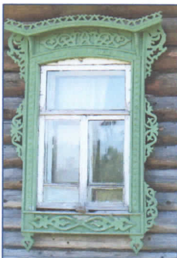
Рис.13. Наличник пятой группы

Наличники пятой группы - наличники с изогнутой полочкой и загнутыми вверх концами, широкой лобовой и подоконной частями. Украшаются накладным и рельефным орнаментом. Колонны выющимся точеным орнаментом, по углам которых располагается символ солнца. Зачастую лобовая доска украшена огибающим ее резным шнуром со свисающими с него кисточками, пышностью резьбы не отличаются (рис.13.)