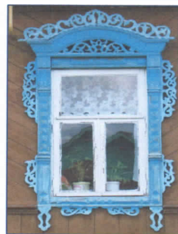
Рис.11. Наличник третьей группы

Наличники третьей группы - с одинарной или двойной аркой, украшенные пропиленной резьбой, нешироким полотенцем и колонками, из токарных или резных деталей. Данная группа встречается наиболее часто. Очелье неширокое, часто обрамленное растительным орнаментом. Внутренняя часть арки полностью закрывает полукруглое отверстие, что является отличительной особенностью для села Мыт. Если сравнивать с наличниками других групп, то это наиболее скромная арка. Колонны украшаются с разрывами и зачастую накладной резьбой, реже точеными деталями. Полотенце узкое, заканчивающееся свисающими кисточками, рисунок скудный, неразнообразный. Средняя часть колонн венчается знаком солнца – сияние. Наиболее часто так украшены дома, построенные после ВОВ (рис.11.).