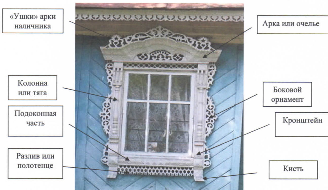
Рис.8. Основные части наличника

В своей работе мы попытались подразделить наличники на определенные группы, исходя из внешнего строения и видов резьбы, использованных для их украшения. Все наличники имеют следующие основные части, названия которых были определены в ходе бесед с резчиками района. Результаты представлены на рисунке 8.