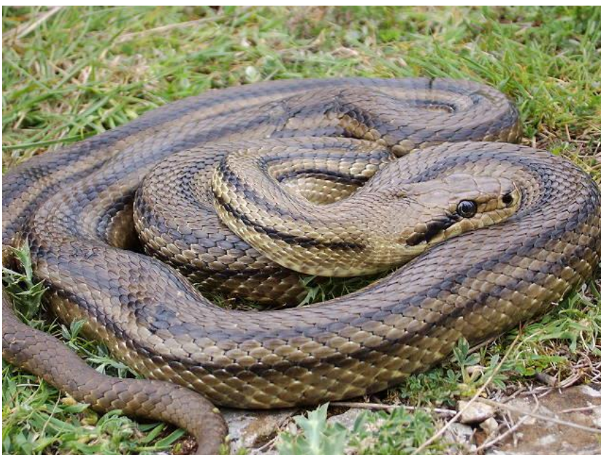
Четырёхполосый лазающий полоз

Последний, встречающийся у нас в Ахтарях вид змей – это медянка. Медянка – небольшая змея серого, медно-красного или жёлто-бурого окраса; бывают и змеи-меланисты, в длину не превышает 70 см. Отличительная черта – полоса, проходящая через глаз. Занимают сухие облесённые места – степи, каменистые участки, луга, поляны.