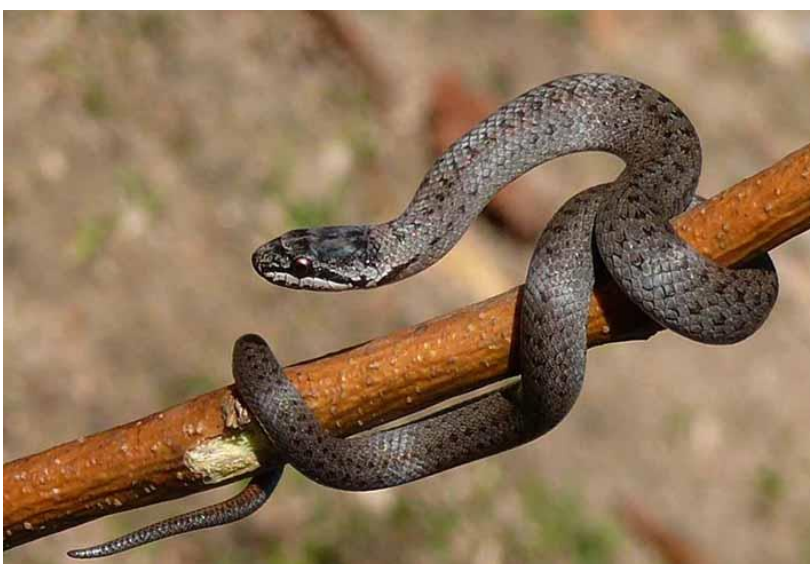
Медянка – самая маленькая змея района

Последний, встречающийся у нас в Ахтарях вид змей – это медянка. Медянка – небольшая змея серого, медно-красного или жёлто-бурого окраса; бывают и змеи-меланисты, в длину не превышает 70 см. Отличительная черта – полоса, проходящая через глаз. Занимают сухие облесённые места – степи, каменистые участки, луга, поляны.