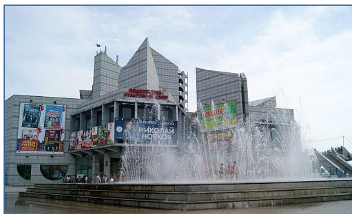
Фонтан на площади ОКЦ.

Автор: Хмелёва Полина Александровна, обучающаяся учебного объединения «Юные любители зелёной архитектуры», 8 класс