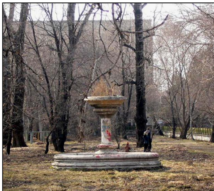
Заброшенный фонтан возле Алексеевской гимназии.

Когда-то здесь шумел фонтан, На солнце брызгами сверкая, И струи пели, как орган, Меня прохладой в зной лаская. Увы, теперь он уж молчит, И слух не радует журчаньем. Ворона, разве, пролетит, Нарушив тяжкое молчанье. Пришли иные времена; А те промчались, как мгновенье. Взросли другие семена. Былое, словно сновиденье.