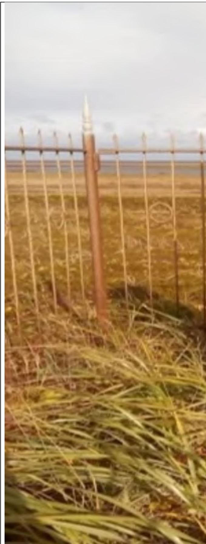
Памятник Трифонову Борису Сергеевичу