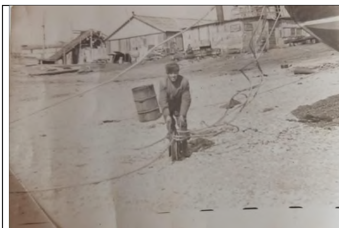
Село Брюмка 1950г