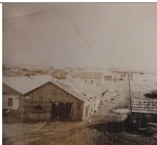
Архивные фото п. Кировский