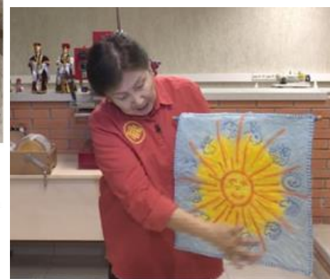
Фото 1. Войлок из собрания Национального музея РК им. Н. Н. Пальмова