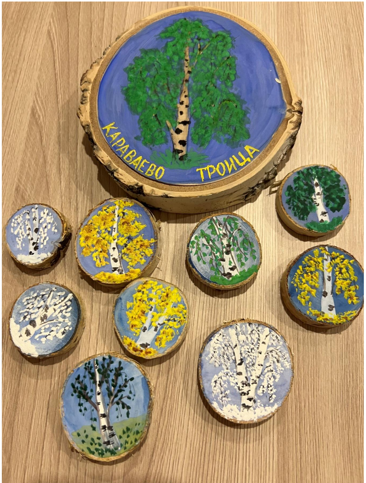
7. Сувенирная продукция - береза красива во все времена года (на спице березы).