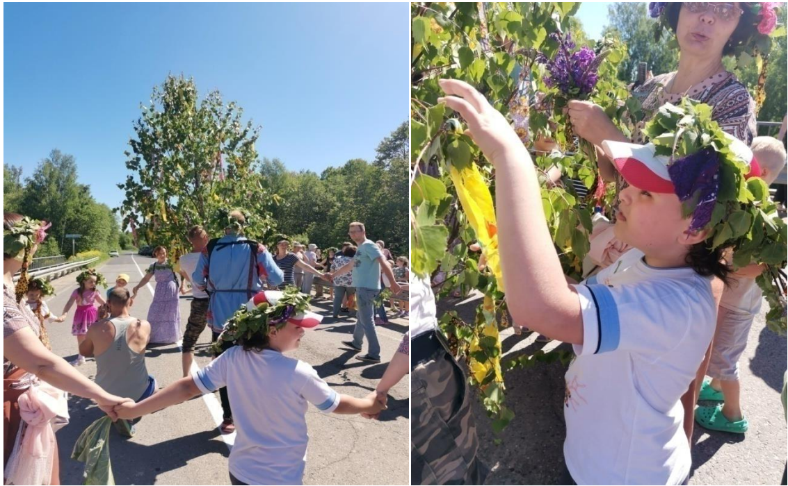
11. На мосту.