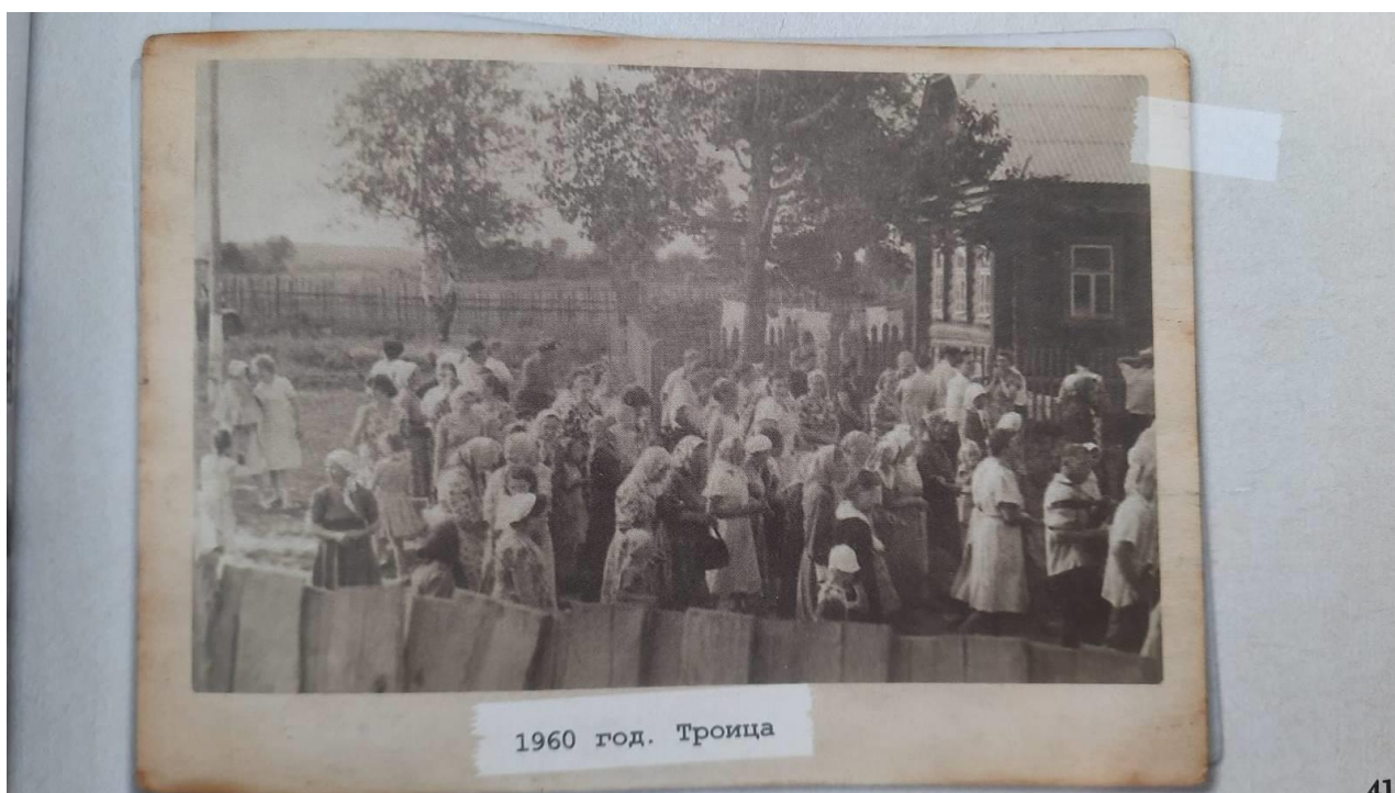
13. Былая старина. 1960 г. село Караваяво.