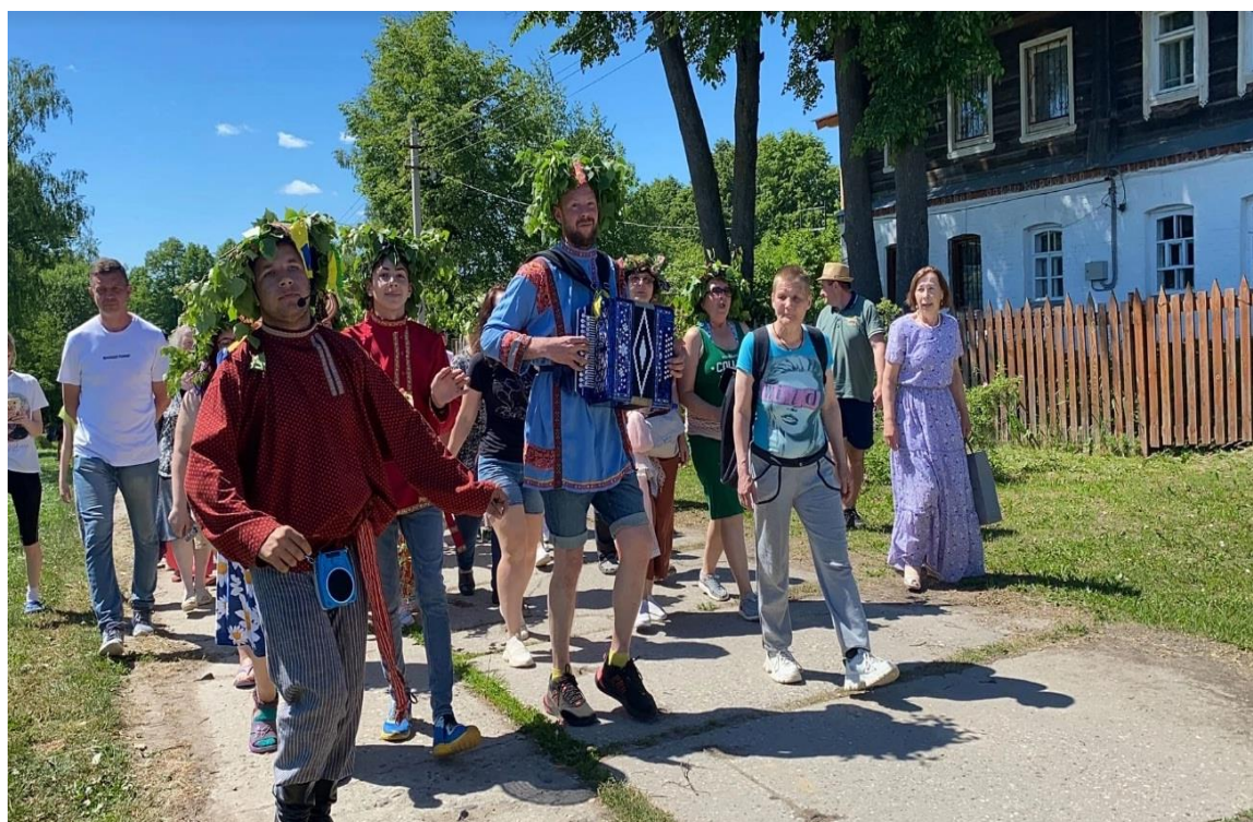
5. Пение на все село.