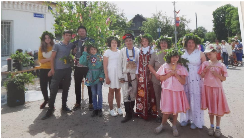
6. Первая остановка (в центре села). Каждый вносит свою лепту в праздник.