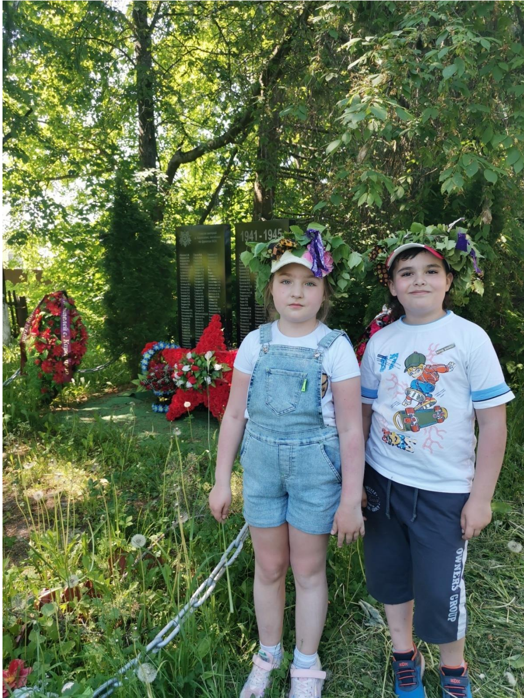
8. Как в былые времена. У обелиска.