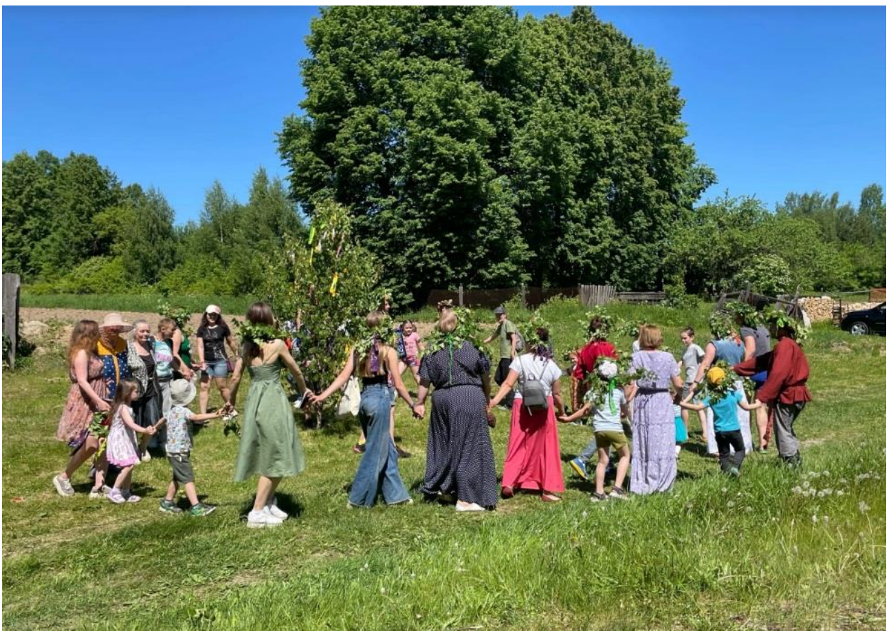
4. Хоровод «Во поле березка стояла»