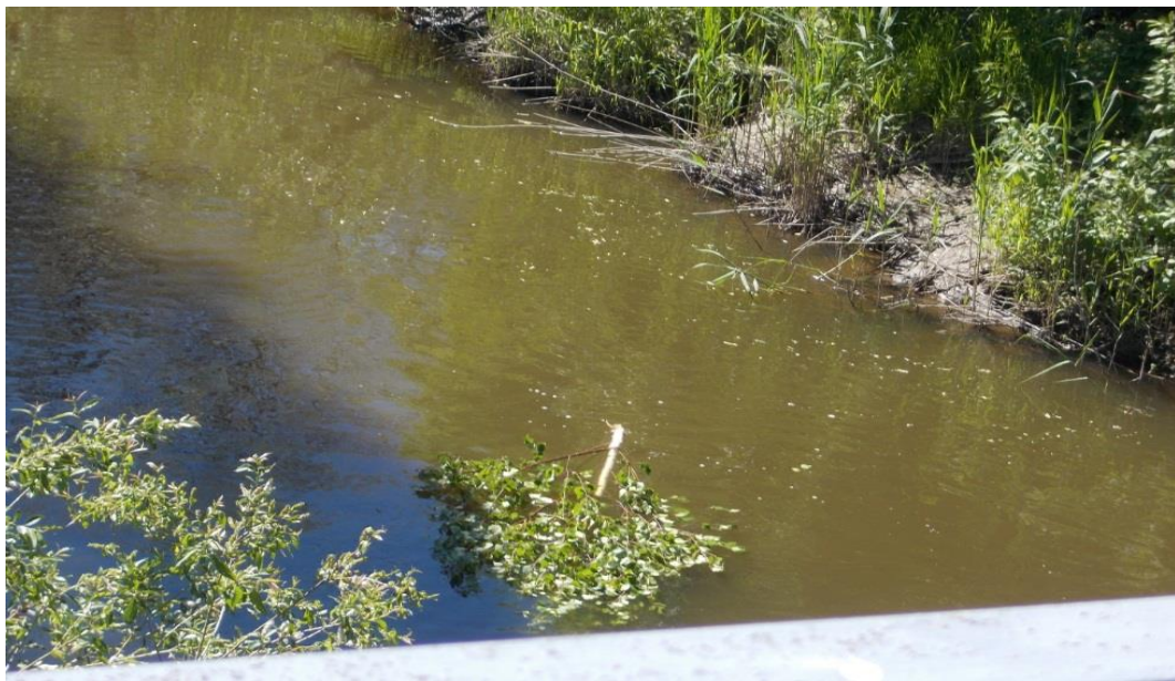
12. Венец праздника. Бросание березки, венков с моста в реку.