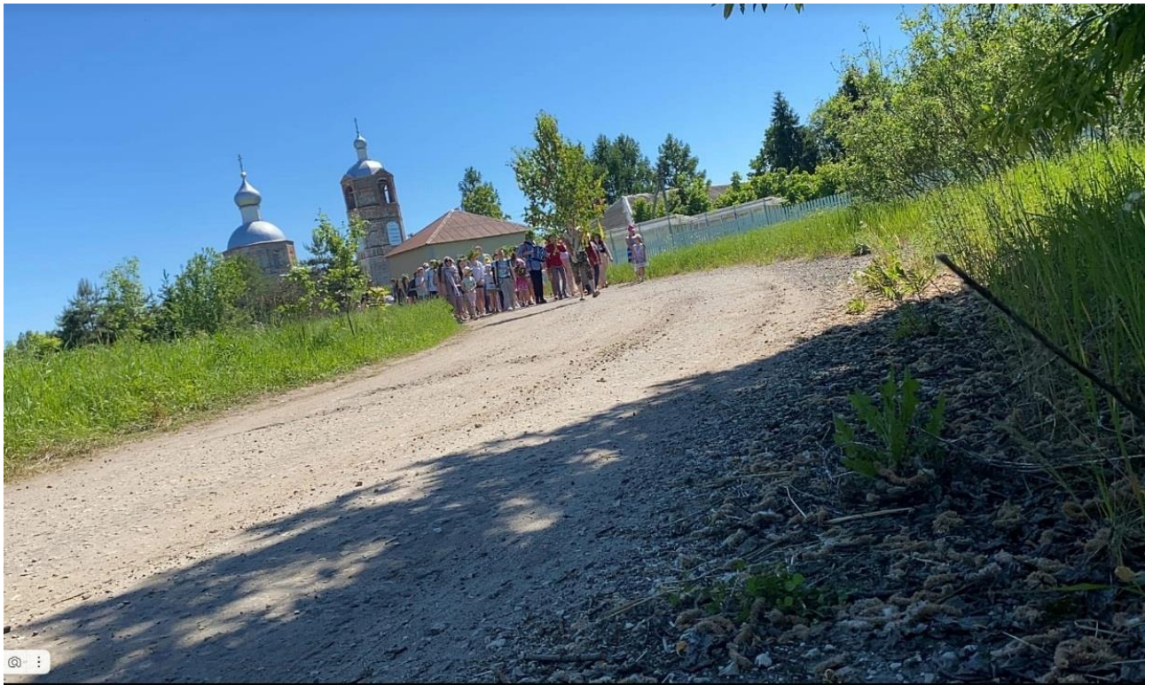
9. Вторая остановка - на конце деревни.