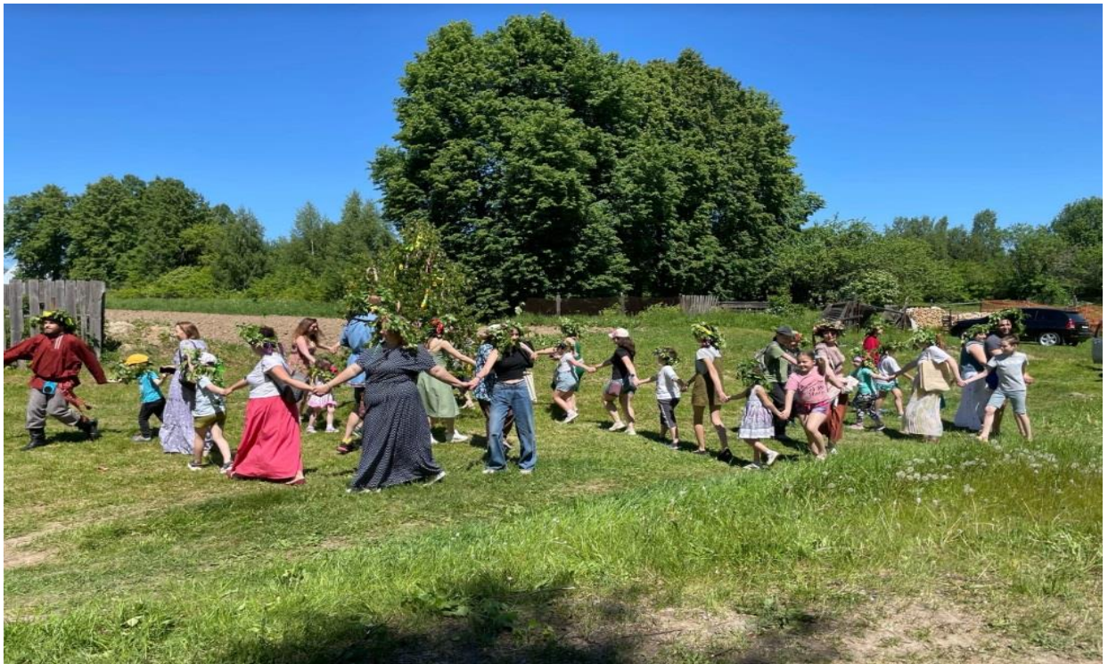
4. Хоровод «Круги»