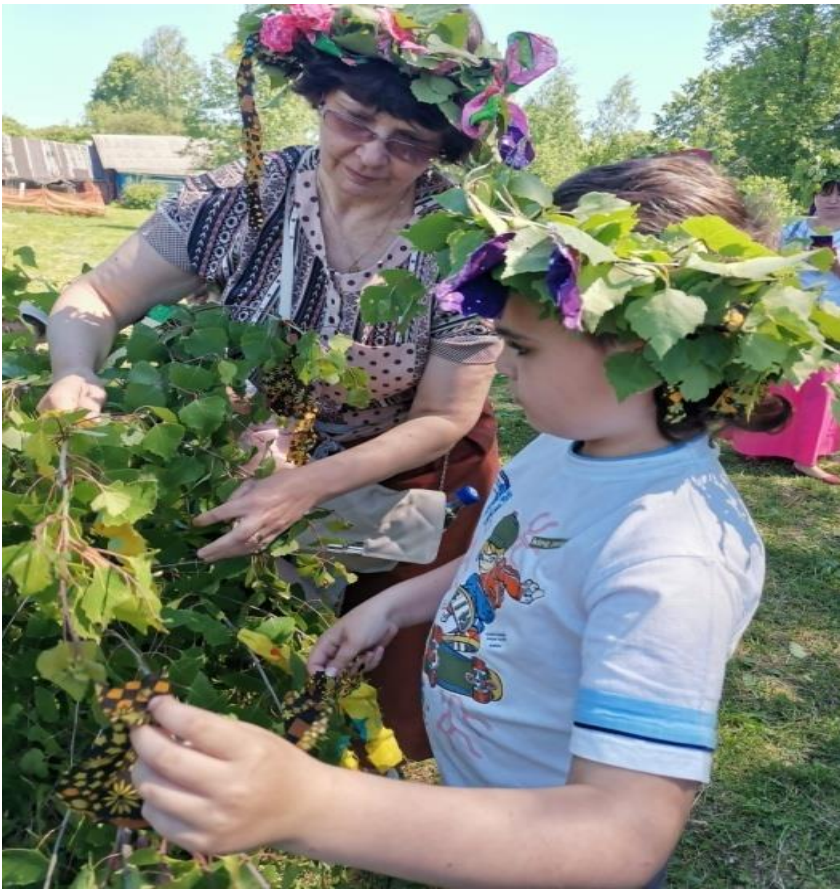
3. Плетение венков.