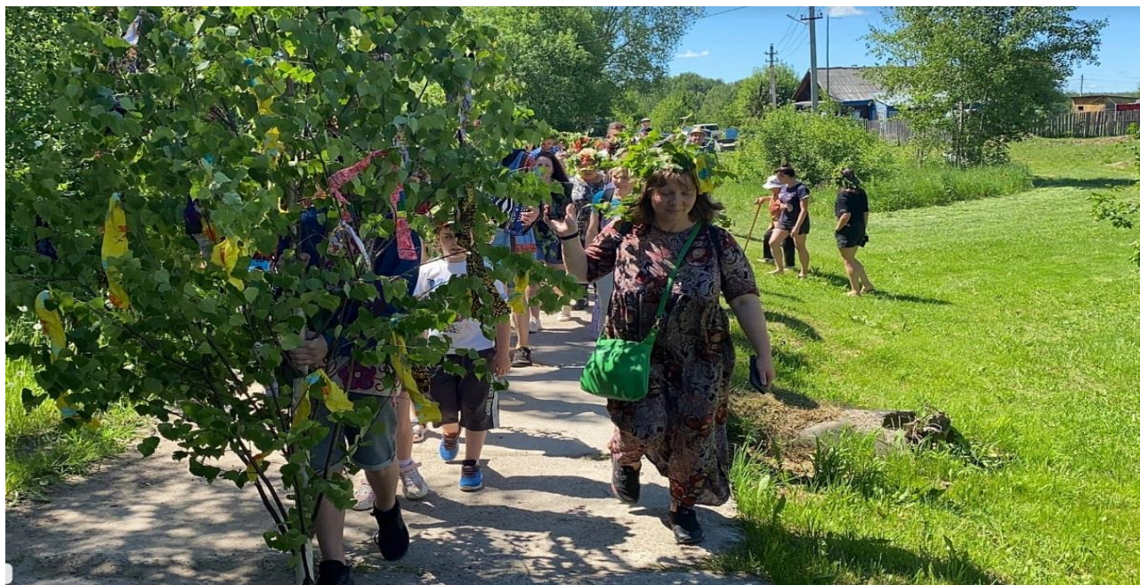
5. Строй за березой, шествие