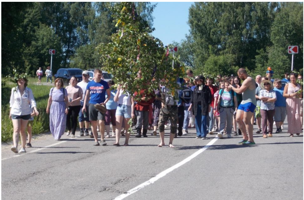
10. Все больше и больше народа становится. Движение к мосту.