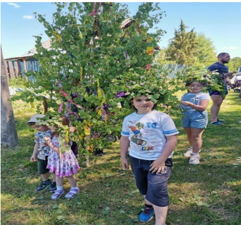
3. Украшение березки.