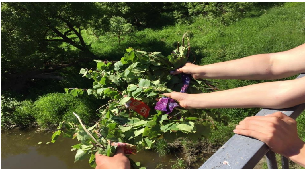
12. Венец праздника. Бросание березки, венков с моста в реку.