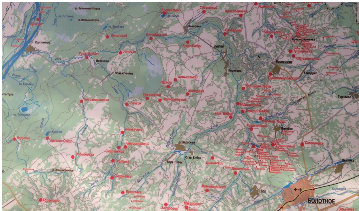
Фрагмент Исторической карты Болотнинского района