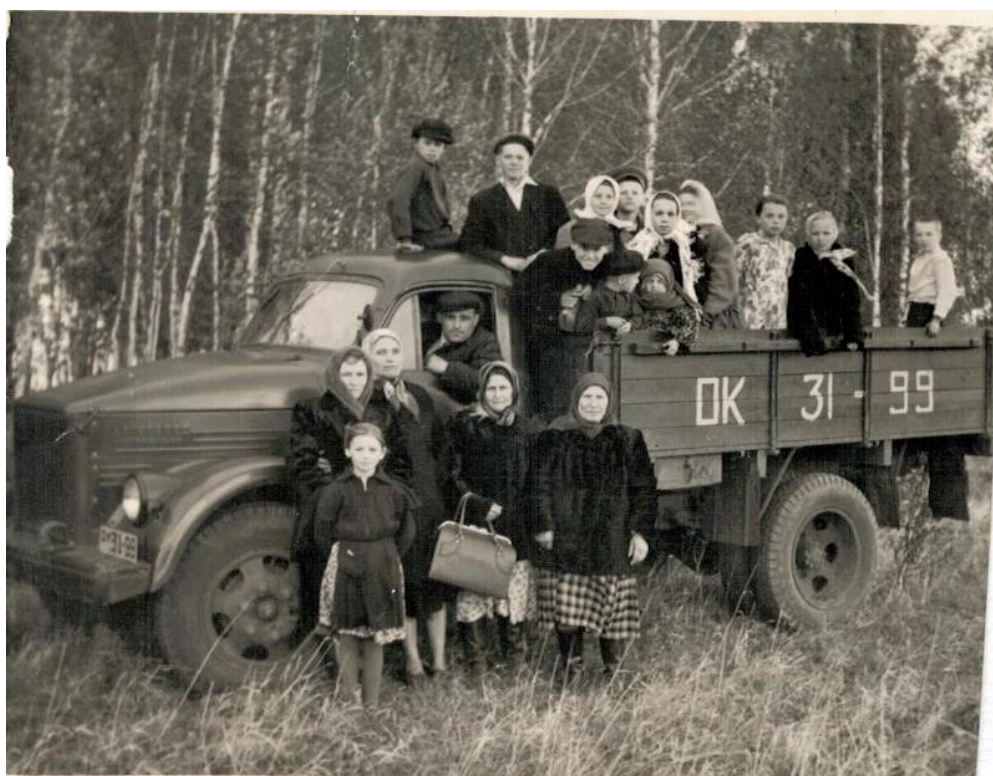
Односельчане деревни Захаровка после праздника