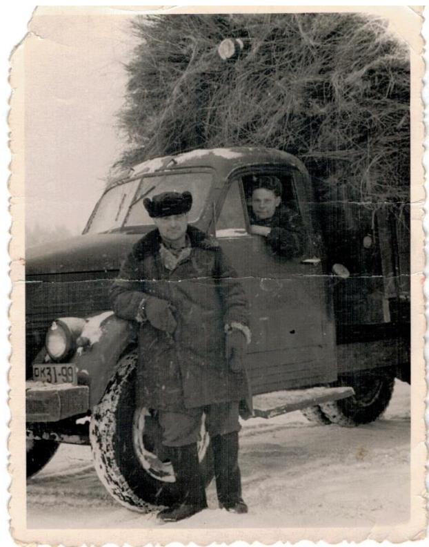
Перевозка льна на льнозавод