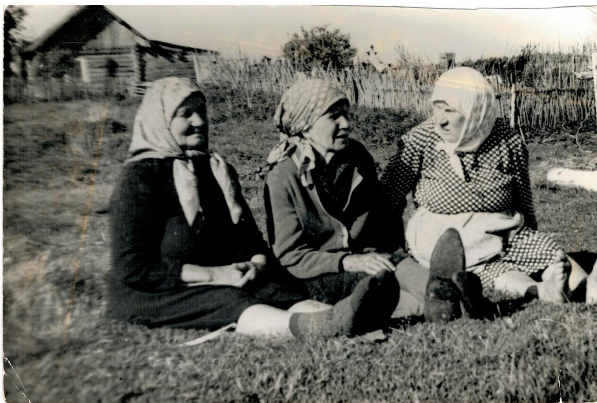
Отдых на лужайке в деревне Захаровка