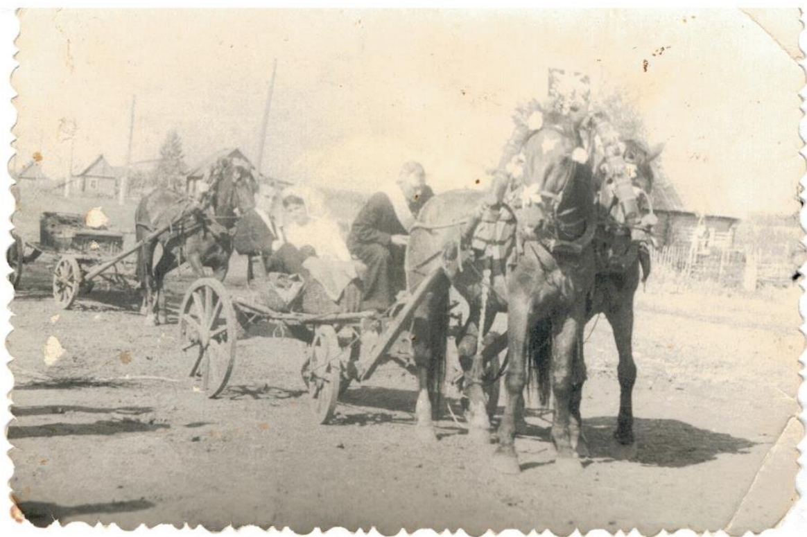
Деревня Захаровка. Свадьба