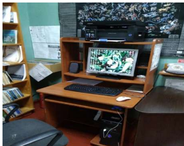
Рабочее место библиотекаря