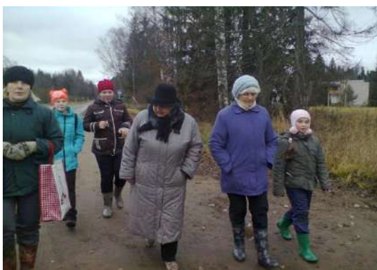
Экскурсия к Румелийским соснам