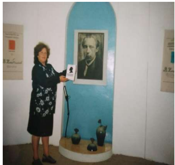
Выставка «Тихая моя Родина» Экскурсия по музею В Хлебникова