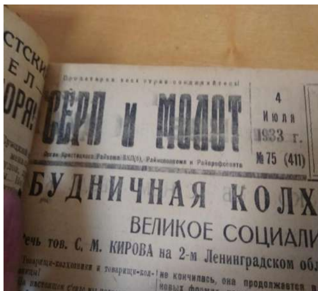
Районная газета «Серп и молот»