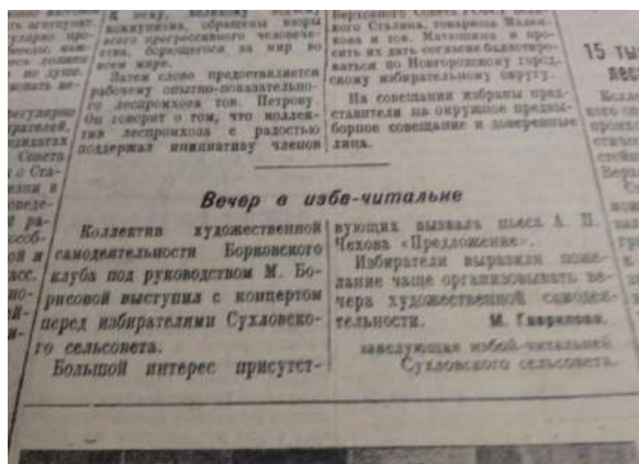
Заметка из районной газеты «Серп и молот» Вечер в избе-читальне Приложение №6