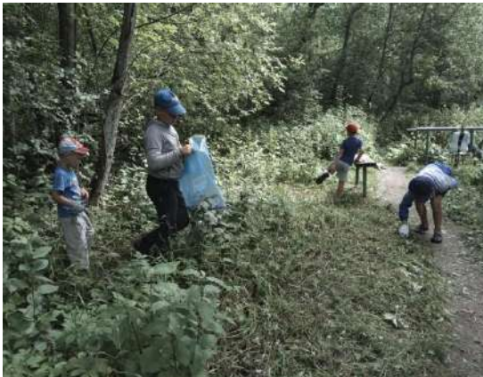
Акция «Чистый берег»