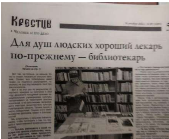
Заметка из газеты «Крестцы»