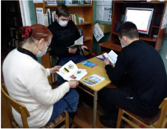
Митинг у братской могилы