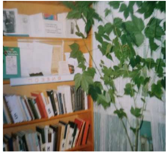
Стеллаж «Поэзия»