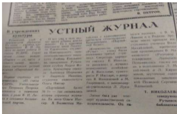
Заметка из газеты «Ленинское знамя» «Устный журнал.