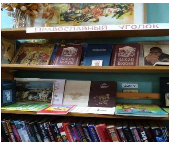
Православная литература