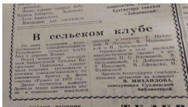
Заметка из газеты «Ленинское знамя» «В сельском клубе»