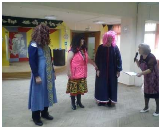
День Пожилого человека