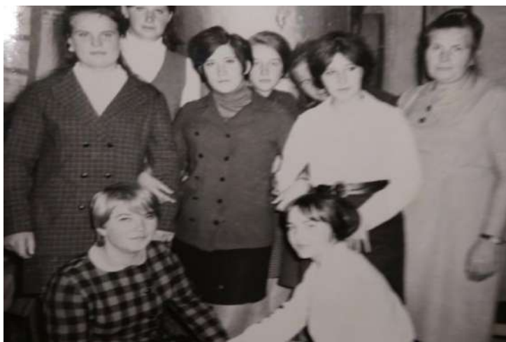
Участники Драматического кружка.