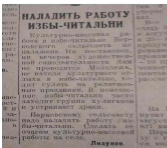
Заметка из районной газеты «Серп и молот» «Наладить работу избы-читальни»