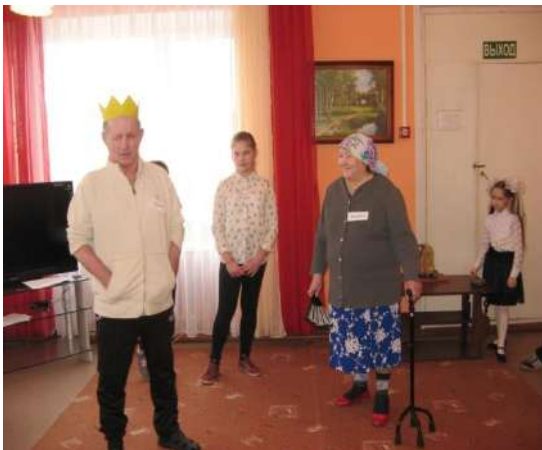
8 марта в доме Ветеранов