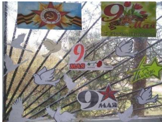
Акция «Окна Победы»