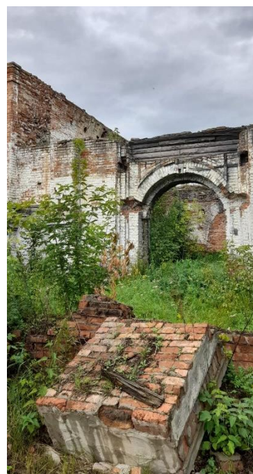
Церковь в поселке Миргородском. Старая фотография и современный вид.