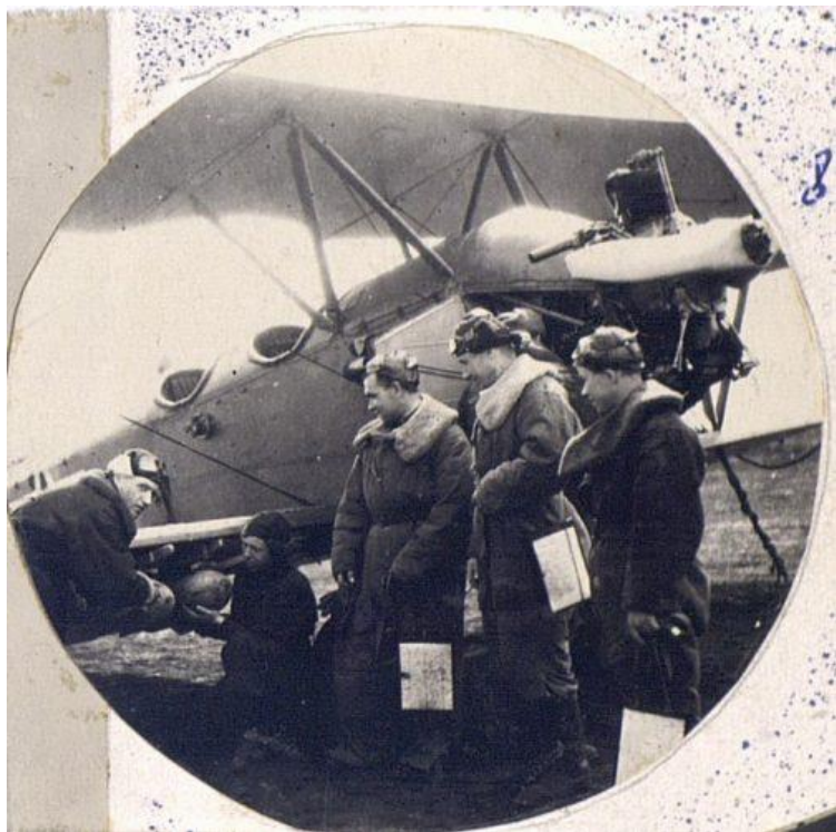
Курсанты 46 запасного авиационного полка в г. Алатырь