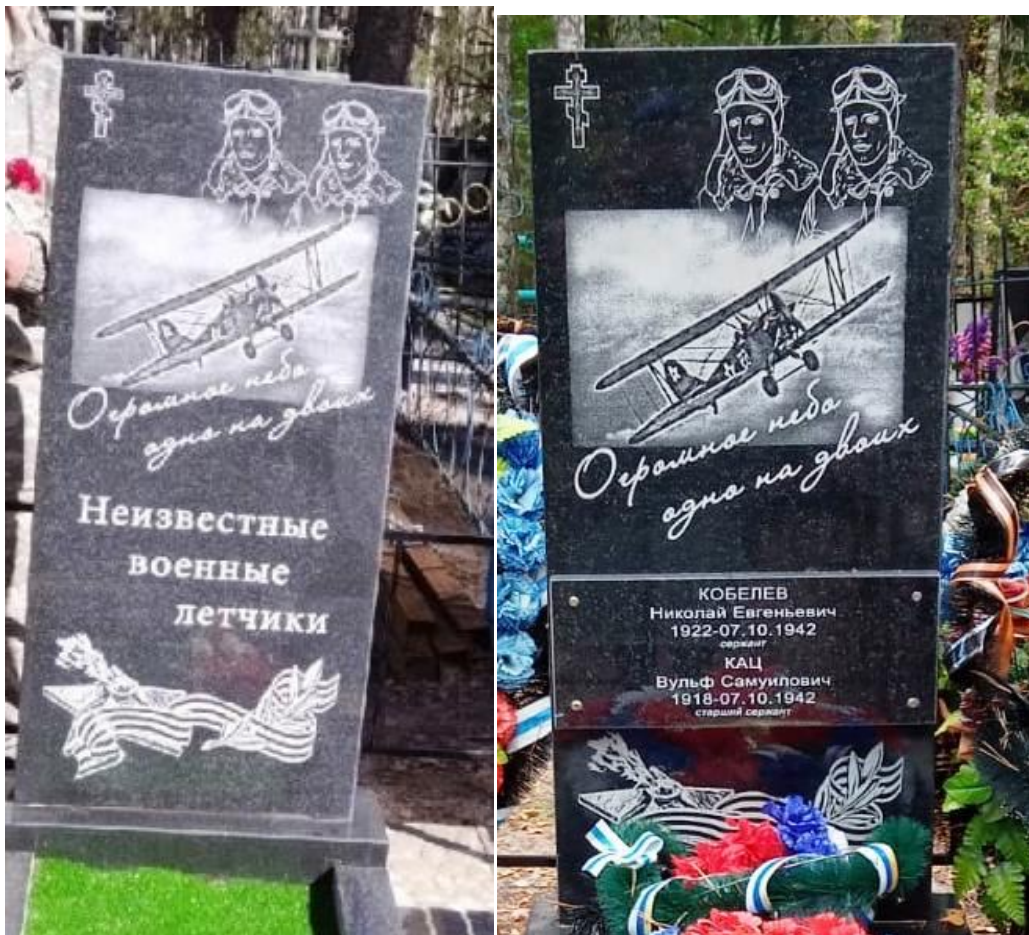
Памятник на могиле летчиков в 2023 и 2024 годах